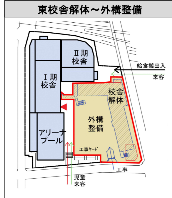
STEP. 5 R8年9月～R9年3月（約7か月）