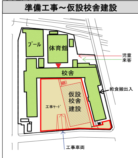
STEP. 1 R2年4月～R2年12月（約9か月）