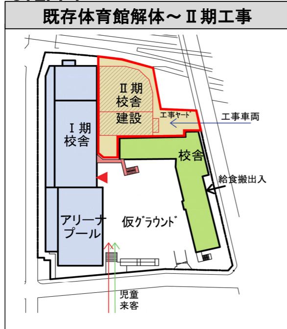
STEP. 4 R6年4月～R8年8月（約2年5か月）