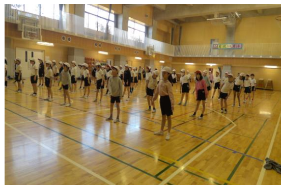
コオーディネーショントレーニングの様子 1月22日・23日