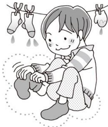
ぬれた靴下や手袋は取り換える