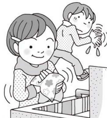
手を洗った後はしっかり拭く