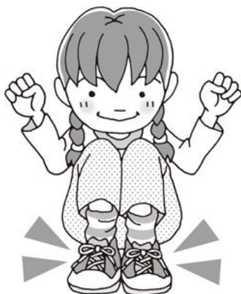
締め付けない靴や靴下を履く