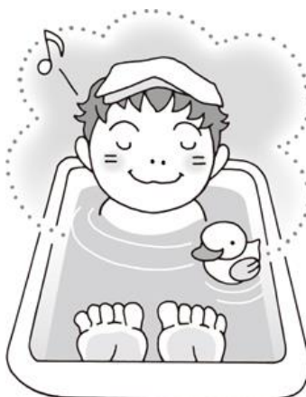
ゆっくり湯船に浸かる