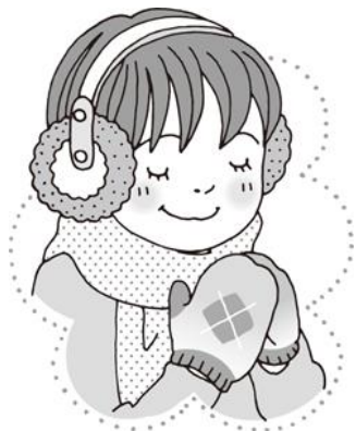
みみ 耳あてや手袋をつける