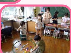
3年でんしょう遊び祭