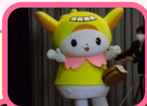
「はねびよん」も登場!

更に、PTAや同窓会と連携し、様々な取組をまとめた記念のDVD製作や資料室の整備も進めました。