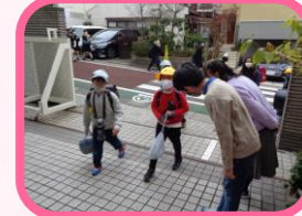
代表委員による挨拶活動

また、他学年との学習交流会など異学年の交流も深めています。今年度は5年生が幼稚園とお手紙による交流を行いました。