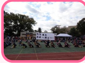
4年 開校95周年記念 体育発表会