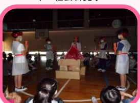
6年 オリジナル移動教室