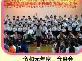
令和元年度 音楽会