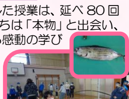
5年 かつおの1本釣り体験