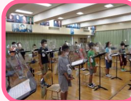
シールドを活用した音楽室

PTAやおやじの会『DUO(田小ウルトラおやじーズ)』、学校支援地域本部『でんしょう応援団』を中心に、保護者・地域の皆様には、学校の教育活動の充実に向け、授業のゲストティーチャーやお手伝い、校外学習の引率等の学習支援、様々な課外活動支援、読み聞かせや校内外の環境整備、今年度ならではの『体育発表会』・『周年記念の会』をはじめとする学校行事のお手伝いなどの学校運営支援に大きな力を発揮していただきました。そして、更に、感染症拡大防止のグッズの御用意もいただき、子どもたちは安心して学校生活を送ることができました。