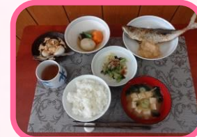
6年 和食のマナー給食

また、各地の郷土料理やオリンピック・パラリンピック教育の一環で、外国の料理も献立に多く上りました。『たてわり班』による交流ランチやセレクト給食、更に、6年生は和食のマナー給食(5年生は洋食を予定)を実施しました。恒例となっている3・4年生のバイキング給食は、感染症拡大防止の観点から中止としました。来年度に御期待ください。