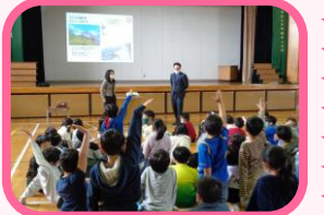
3年 スイス大使館との交流