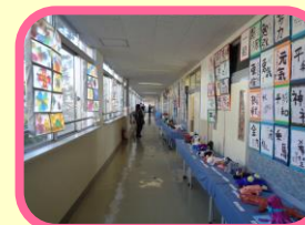
開校95周年記念展覧会