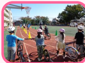
3年 自転車安全教室