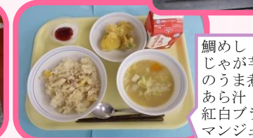
開校95周年記念献立