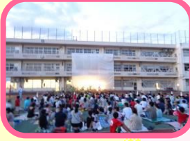
令和元年度 星空映画会