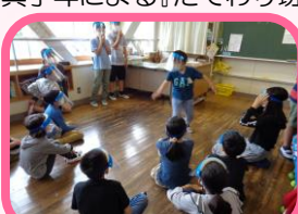
たてわり遊び集会