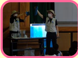
4年 水道キャラバン