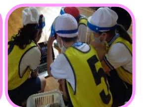
フェイスシールドを使った話し合い