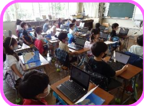
タブレット端末を活用した授業

一人1台、タブレット端末が貸し出され、様々な授業で活用されています。自分が調べたことをスライドにまとめ、発表することもあります。