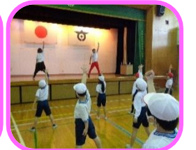
文化芸術授業(ダンス)

登校時や休み時間の前後など、新型コロナウイルス感染症対策のため、手洗いや消毒を行っています。給食の時間は、全員が前を向いて食べています。