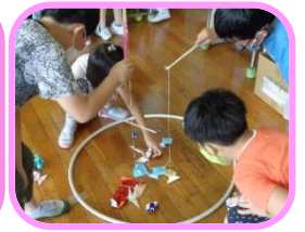
でんしょう遊び祭