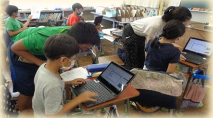
6年生と3年生の合同授業