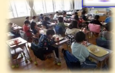
給食の様子 (黙食・ディスタンス・スライド上映)