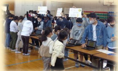
6年生 プログラミングゲームの 紹介・体験会