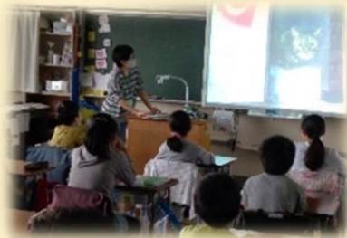
お話ポケット (保護者・地域の方による朝の読み聞かせ)