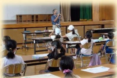
わくわくスクール (同窓会による講座)