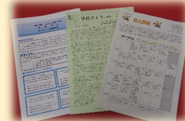
学校紹介・学校だより・学年だより