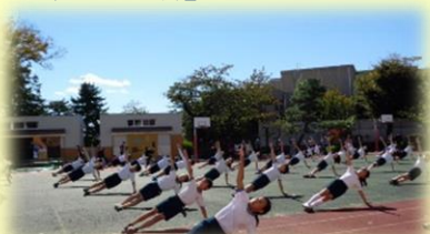
体育健康教育の充実