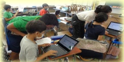
6年生と3年生の合同授業