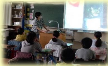
お話ポケット (PTAサークルによる朝の読み聞かせ)