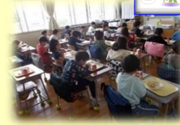
給食の様子 (黙食・ディスタンス・スライド上映)