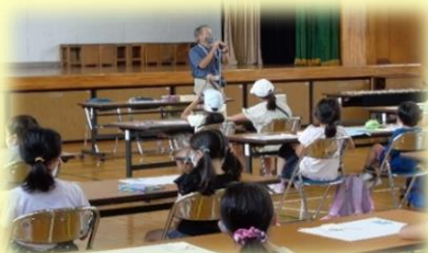
わくわくスクール (同窓会による講座)