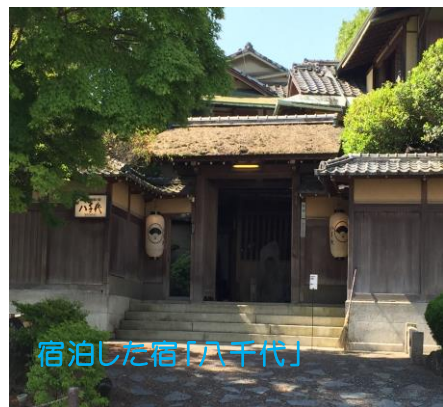
宿泊した宿「八千代」