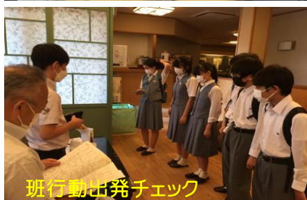
班行動出発チェック