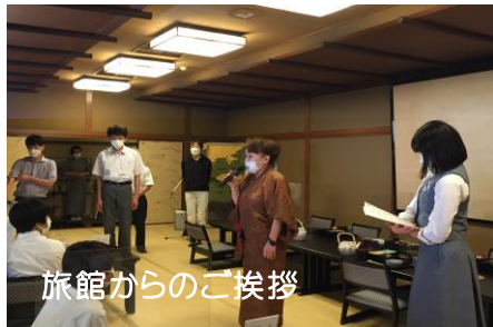
旅館からのご挨拶