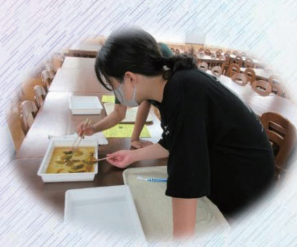
羽田中 葉脈標本づくり