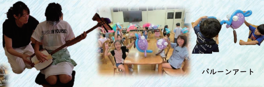
三味線を ひいてみよう