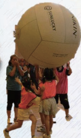
キンボールスポーツ を楽しもう！！