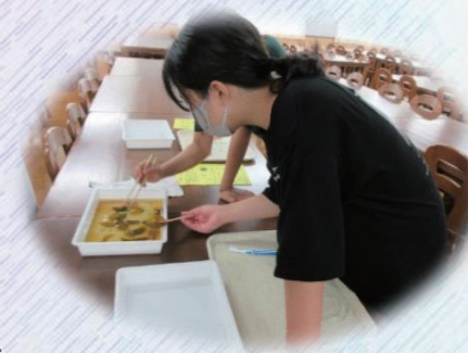
羽田中 葉脈標本づくり