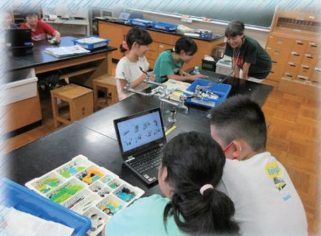
プログラミング教室