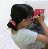
筆と仲良くなろう