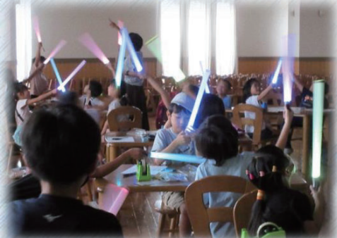
ライトセーバーを作ろう