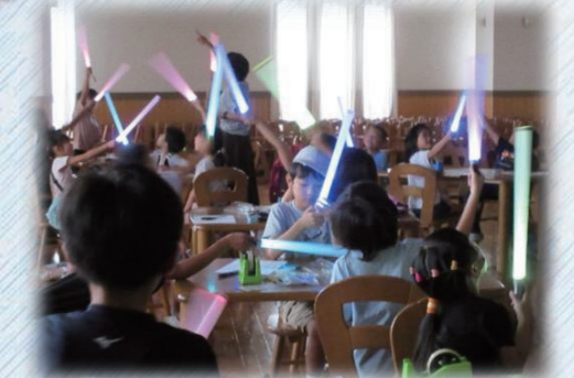
ライトセーバーを作ろう