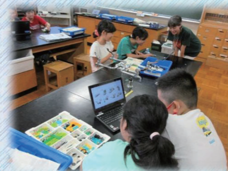
プログラミング教室