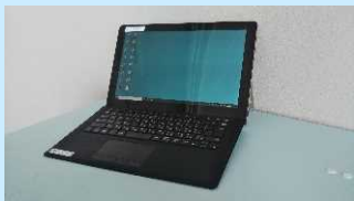
生徒貸出用タブレットパソコン