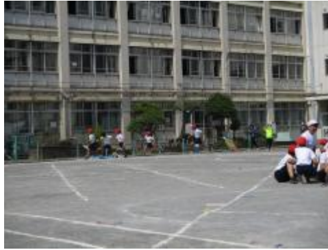
6年生 100m 走