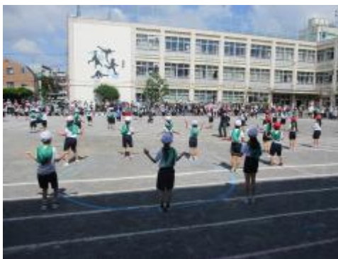
2年生 円の形に移動した様子