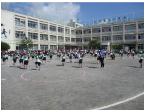
2年生 表現運動 最初の位置

表現運動では、毎回の練習を楽しんで取り組んできた子どもたちでしたが、今までで一番の輝きを放った演技でした。笑顔で踊る子どもたちに、私たちが笑顔になりました。（運動会後の昼休みの時間にも、「先生、踊りたい!」と繰り返し踊っていました。）