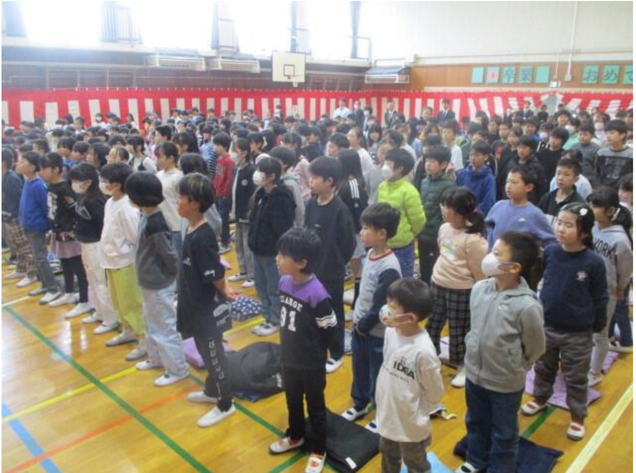
各学級の代表児童が、修了証を受け取りました。