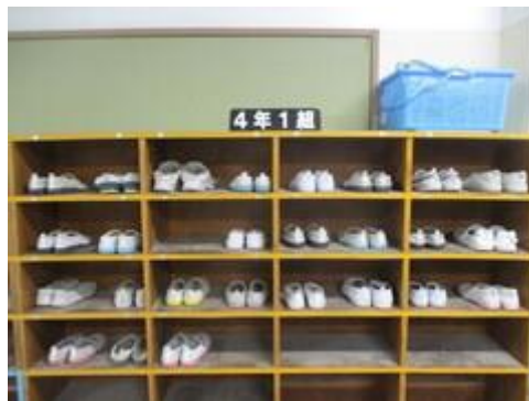
3/13 立つ鳥跡を濁さず