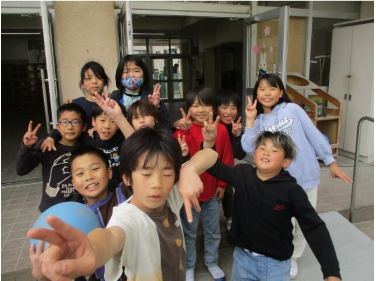
3/13 今朝の靴箱 172