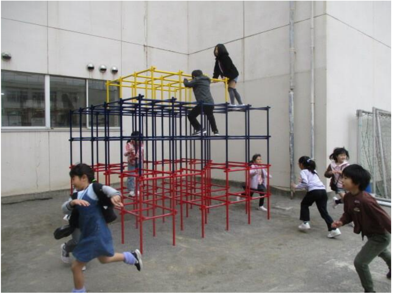
3/25 笑顔が最高！ vol.341