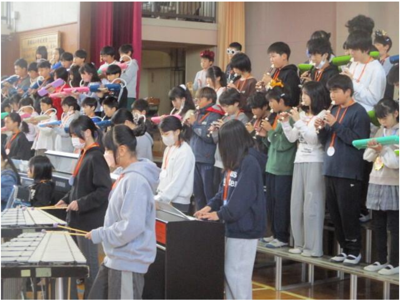
全校合唱『ピリーブ』