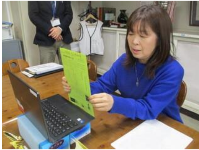
数々の表彰を行いました。