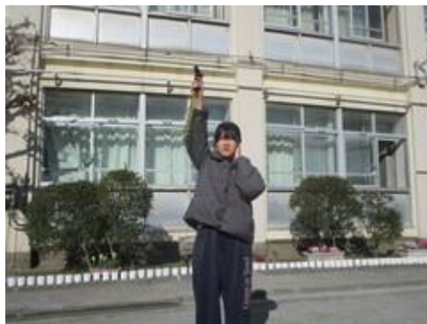
3/11 この日に避難訓練