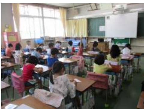
たくさんの「ありがとう」を