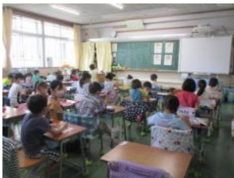
たくさんの「ありがとう」を

本日は、学校公開がありました。児童は、初めての学校公開で少し緊張していましたが、一生懸命に学習に取り組みました。学習を通して、自分たちを支えてくれている人に感謝することについての考えを広げることができましたと思います。