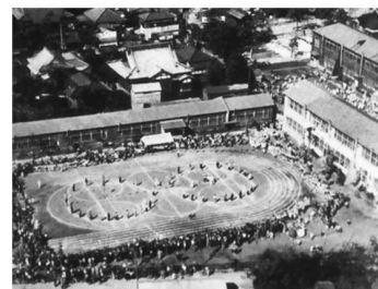
昭和29年大運動会（木造校舎時代）