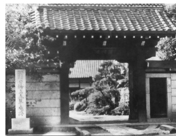
学校の開かれた理境院