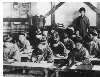
明治のころの授業（家庭科）