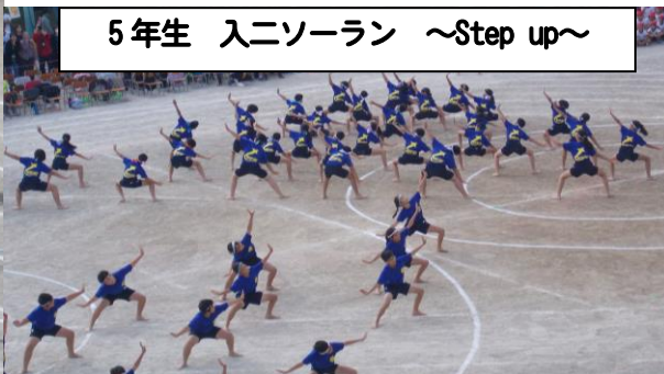
5年生 入二ソーラン ～Step up～