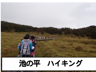
池の平 ハイキング

大きなけがや、病気もなく、全員が全ての行程をできたことが大変素晴らしかったです。スローガンの通り、全員で力を合わせて成長を感じられる移動教室となりました。この体験を、これからの学校生活に生かしてほしいと願っています。