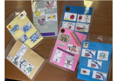
【わくわくスクールしおり】