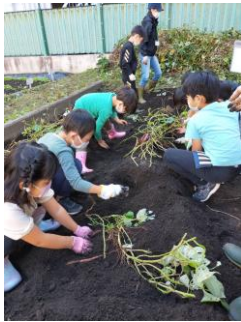
さつまいもの収穫