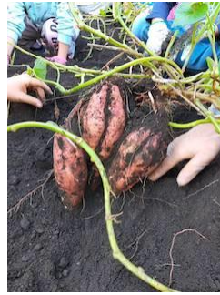
大きく育ったさつまいも