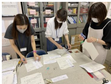
申込者の集計の様子

活動内容・夏休みのわくわくスクールの開講のための準備（講師依頼や開講に必要な準備）をしております。例年は夏休み前半の平日10日間、学校の教室や体育館・校庭をお借りし30～40講座を開講していましたが、コロナ禍により、一昨年は自宅でできるようにHPに動画を掲載したり、製作キットを配布する形で開講しました。昨年は感染症対策をした上で小規模ながら先生がたのご協力もあり、全学年が参加できる講座を開講することができました。コロナが落ち着いたら、講座数を増やしていく予定です。