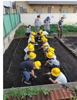
畝を作っているところ