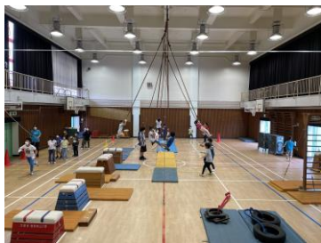
いりごサスケ いりご特製アスレチック 忍者のように障害物を器用に こなしていました。