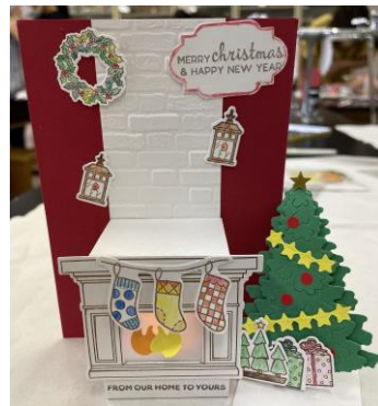
グリーティングカード 季節を先取りしてクリスマス カードを作りました。