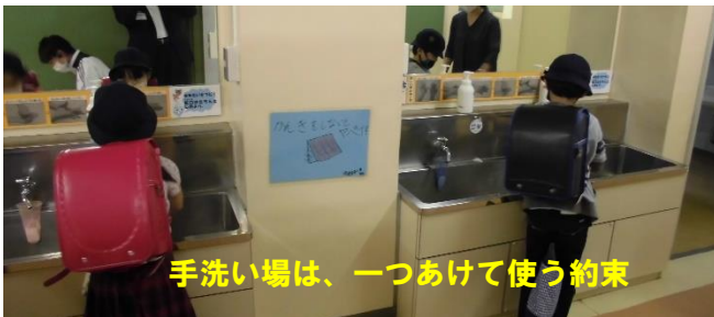
手洗い場は、一つあけて使う約束

今日は、朝からあいにくの雨模様でしたが、子どもたちは、比較的こやかに登校できていたように思います。担任の先生の健康チェックが行われ、その間に、手洗いを済ませ教室に入ります。