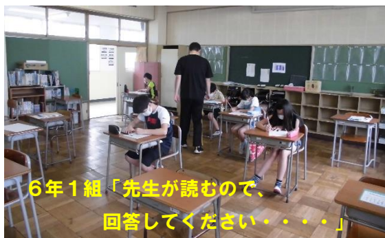
6年1組「先生が読むので、回答してください・・・」