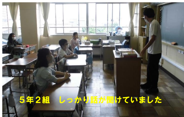
5年2組 しっかり話が聞けていました

欠席の状況ですが、お陰様でほとんど欠席がありませんでした。 2・5・6年生全員で182名の在籍に対し、お休みは1名のみでした。 たくさんお休みの子がいるのではと心配していたので、少し安心しました。一方、マスク忘れと検温忘れが数名おりました。ご家庭の協力をお願いします。また、各学年の様子を見ながら、 今週中に休校中の子どもたちの様子や学校再開の不安などを把握するための、アンケートを取らせていただきます。 なお、 1・2年生は、簡単な質問用紙を改めて作成し、実施したいと思います。 児童の精神面の状況をつかみ、今後の指導に生かしてまいります。