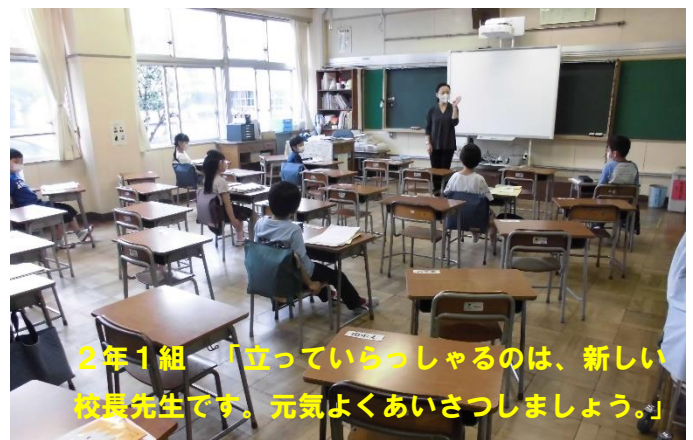
2年1組 「立っていらっしやるのは、新しい校長先生です。元気よくあいさつしましょう。」

それぞれの教室では、在籍児童を3分割し、およそ2メートルの間隔をあけて先生の話をお聞きします。教室がガラガラな感じがして、いつもの学校生活に戻ったという感じはしませんが、子どもたちもそのあたりはウイルス対応と理解しているようです。宿題を提出し、配布物を確認することから始まりました。先生とのやり取りを重ねるうちに、少しずつ緊張がほどけていきました。