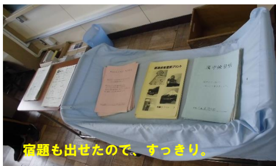
宿題も出せたので、すっきり。

明日は、1年生だけの登校です。初めての登校ですので、教職員一同、万全の体制で迎えます。保護者の皆様方には、あらためてお子さんと一緒に通学路を確かめていただけると幸いです。