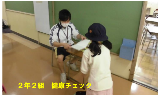
2年2組 健康チェック

久々に先生との再会、4月6日の始業式以来の先生との対面に、子どもたちのうれしそうな様子が感じられました。先生たちも、明るい声でうれしそうでした。