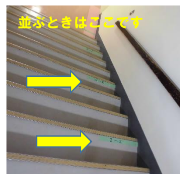
並ぶときはここです