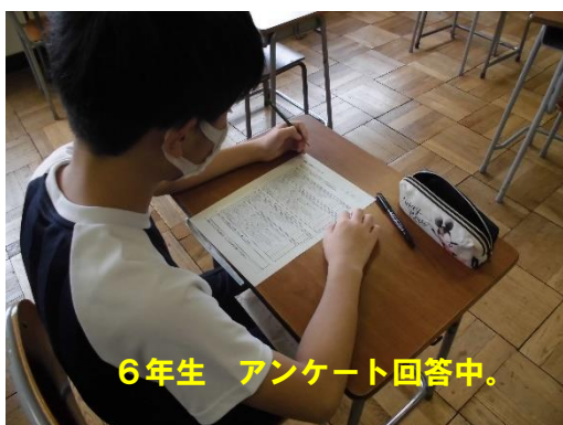
6年生 アンケート回答中。

欠席の状況ですが、お陰様でほとんど欠席がありませんでした。 2・5・6年生全員で182名の在籍に対し、お休みは1名のみでした。 たくさんお休みの子がいるのではと心配していたので、少し安心しました。一方、マスク忘れと検温忘れが数名おりました。ご家庭の協力をお願いします。また、各学年の様子を見ながら、 今週中に休校中の子どもたちの様子や学校再開の不安などを把握するための、アンケートを取らせていただきます。 なお、 1・2年生は、簡単な質問用紙を改めて作成し、実施したいと思います。 児童の精神面の状況をつかみ、今後の指導に生かしてまいります。