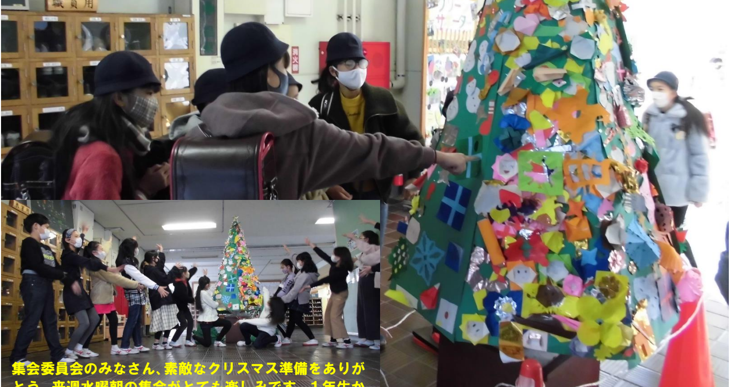
集会委員会のみなさん、素敵なクリスマス準備をありがとうございます。来週水曜朝の集会がとても楽しみです。1年生から6年生までみんなが楽しんでくれると思いますよ。