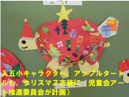
入五小キャラクター、アップルタートルも、クリスマス衣装に（児童会アート推進委員会が計画）

朝、登校してきた子どもたちからは、「ウォーッ！すごーい！！」「クリスマスツリーだあ！」など、反応は上々。自分たちの作ったクリスマスツリーを眺めながら、ワイワイ楽しんでいました。