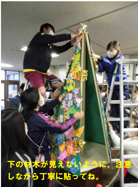
下の材木が見えないように、注意しながら丁寧に貼ってね。

6学年分のクリスマス飾りは、夕暮れ時の寒い中、先生方が力を合わせて貼りつけてくれました。