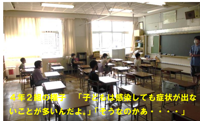
4年2組の様子 「子どもは感染しても症状が出ないことが多いんだよ。」「そうなのかなぁ・・・」

文部科学省から、全児童に布マスクが配布されました。アベノマスクとは、別のものです。