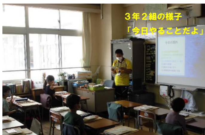
3年2組の様子 「今日やることだよ」