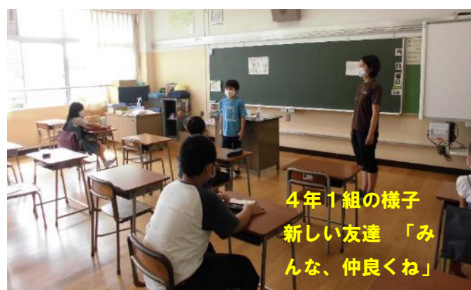
4年1組の様子 新しい友達 「みんな、仲良くな」