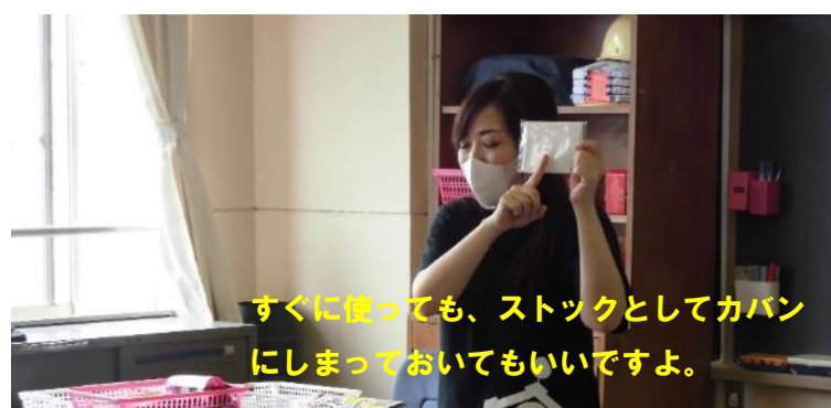
すぐに使っても、ストックとしてカバンにしまっておいてもいいですよ。

文部科学省から、全児童に布マスクが配布されました。アベノマスクとは、別のものです。