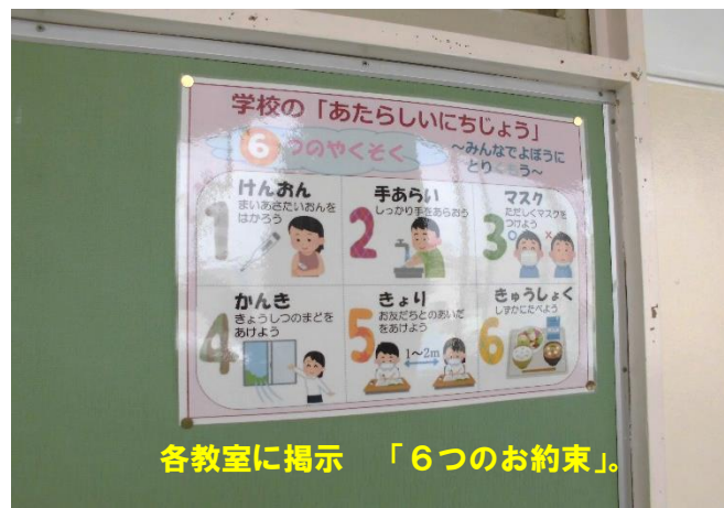
各教室に掲示 「6つのお約束」。