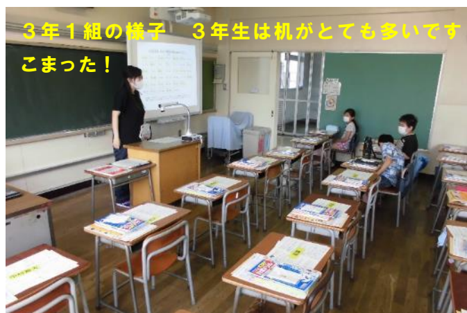
3年1組の様子 3年生は机がとても多いです こまった！

各クラスの様子 4年生には新しい友達が仲間入り。みんなの前で、上手にあいさつができました。3年生は、とにかく机が多いです。第4週以降の状況がどうなるか今のところ分かりませんが、一斉授業になった場合の対策は早急に練る必要があるなど感じています。