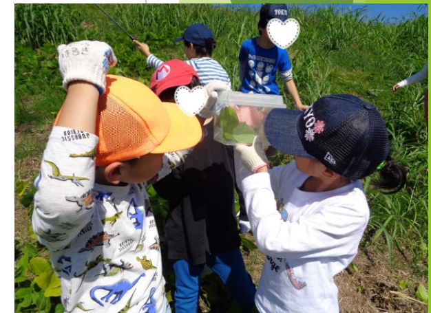
生活科見学での交流の様子