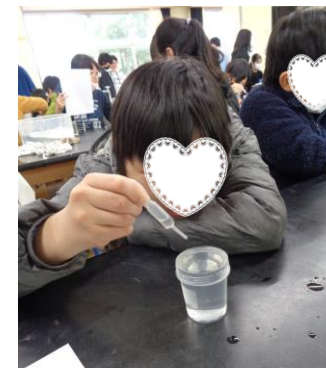
科学クラブでの交流の様子