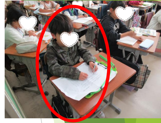
社会科での共同学習の様子

本校では、共に尊重し合い協働して生活できるよう、交流学習・共同学習を行っています。子ども達が互いに自然な心でふれ合えるように、温かな御配慮と御協力をお願いいたします。