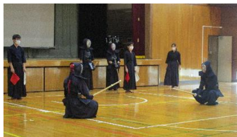
試合さながらの気迫