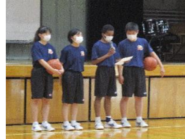
シュートを決めて