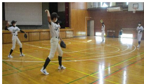
グローブでキャッチする音が響く