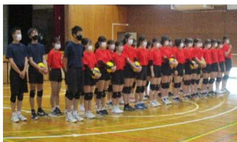
めざせ「あいさつ日本ー！」