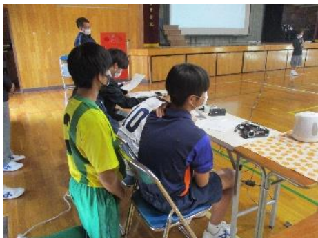
司会進行も部長やキャプテンが担当

4月11日（火）部活動説明会が開かれました。生徒が主体となって在校生から新入生に部活動を紹介しました。どの部活動も工夫をしながら発表しており、1年生も興味津々、身を乗り出して参加していました。