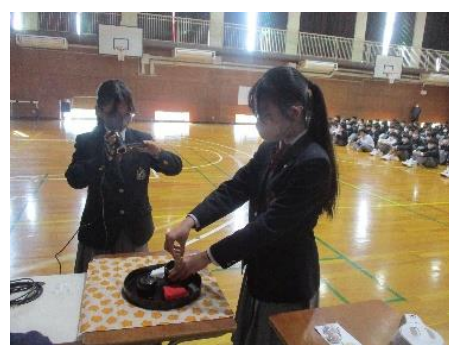
お点前をスクリーンに投影