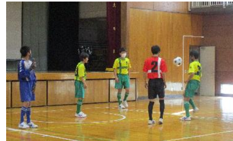
パス練習の様子を披露