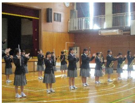
奏でるハーモニー