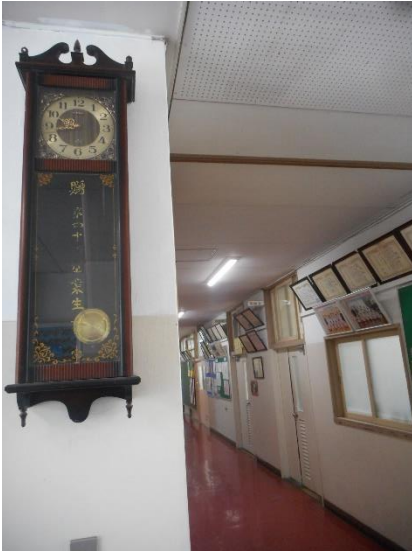
＜卒業生から寄贈の時計＞

「ポーン ポーン・・・」あたたかく、すべてを包み込むようなこの音は、本校の玄関にある振り子時計の音です。幼少時、私の祖母の家にもあったことを懐かしく思い出します。8時、9時 など定時にその数だけ音が鳴ると、慌ただしい日常の中で「大丈夫だよ。深呼吸していこう。」と優しく励ましてくれているような気がして、ほっとします。