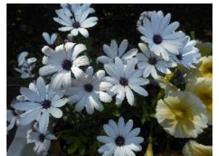
＜生徒会役員による

4月22日（土）に学校公開・保護者会を実施いたしました。在籍生徒数の7割を超える保護者の皆さまにご来校いただき、熱意あふれる一日となりました。日ごろの学校の様子をご覧いただくとともにアンケートにもたくさんご協力いただきました。貴重なご意見を参考に、今後も前進してまいります。6月3日（土）の体育祭に向けて、実行委員の生徒も動き出しました。子どもたちのがんばる姿をぜひご覧ください。