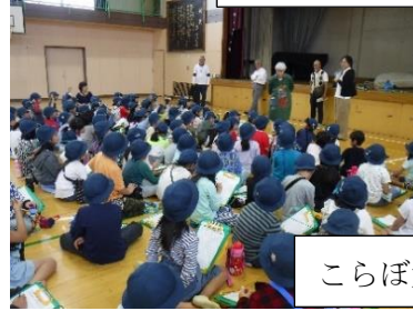
こらぼ大森の見学