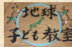
日本語学級 「地球子ども教室」