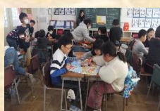
縦割り班活動では協調を