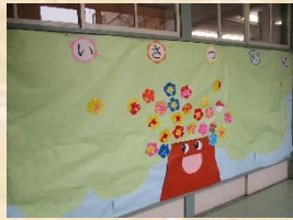
取り組んだ「あいさつの花」