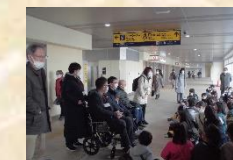
京急蒲田駅 利用者との交流