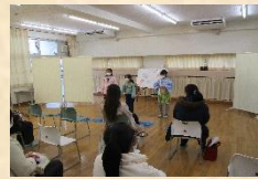
日本語学級学習発表会