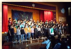
学習発表会では認め合いを