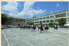
運動会では協力を