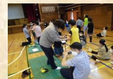
特別養護老人ホーム 職員との交流