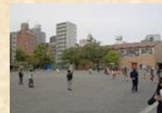
学校地域支援本部 (朝遊び)