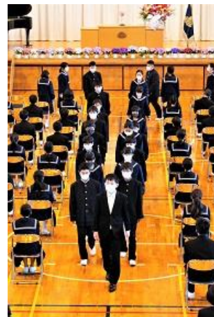
入学式 (新たな出発)