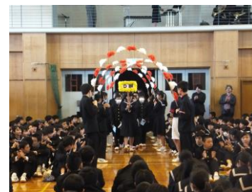
4月10日 新入生歓迎会