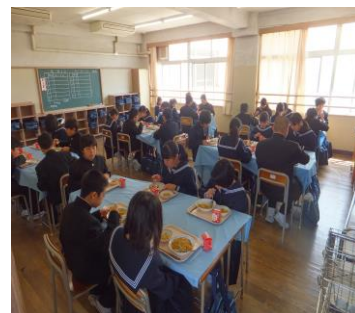
1年生 給食時の様子

※4月29日(日) 子どもガーデンパーティー萩中会場(本校の吹奏楽部・和太鼓部・軽音楽部が出演します)