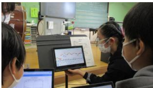
ソングメーカーの画面を見ながら聴き合う