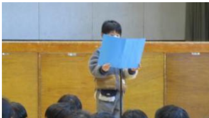
児童代表の言葉の 1 年生