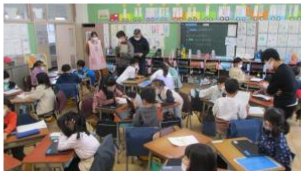
1年2組の事前研究授業(11月28日)

※ 4組の事前研究授業については、11月24日の「馬込の日々」で紹介しています。