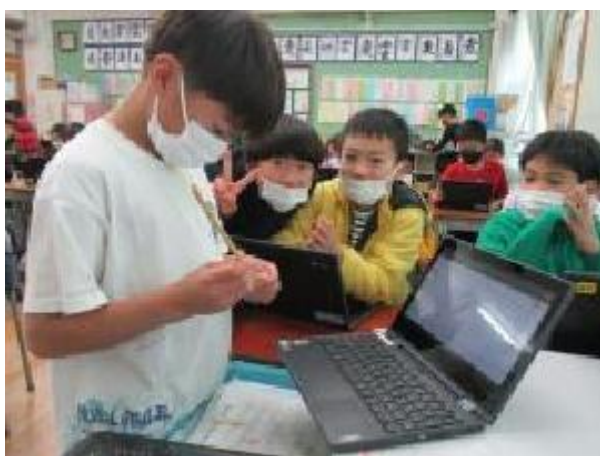
実物の麦を見ながら、麦わら細工の工程を振り返っています♪