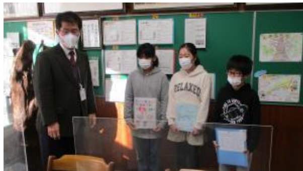
図書館を使った調べる学習コンクールの表彰

朝会のはじめに、表彰を行いました。 まず、「図書館を使った調べる学習コンクール」出展の3名です。 夏休みの自由研究で取り組んだ成果です。それぞれ、花火、地震、石・岩石についての研究をまとめました。たいへん立派です。