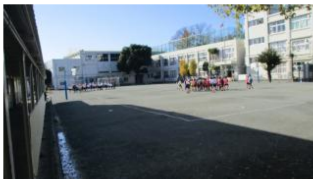
体育の時間の4年生。先生の指示で緊急集合！