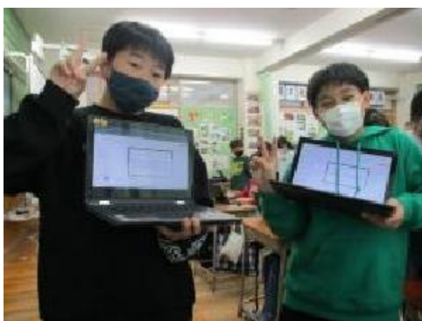
進み具合を確認させてもらいました！順調です★