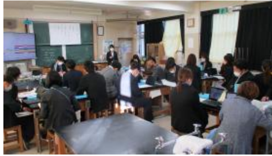
授業後の研究協議会

子どもたちそれぞれが持つタブレット端末上で「ソングメーカー」というツールを使って音楽づくりに取り組みました。この時間は小グループの中で互いにつくった音楽を聴き合い、感じたイメージや感じ取ったよさなどについて意見交換しました。