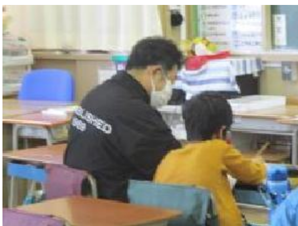
先生に九九を聞いてもらっています。

2年生はかけ算九九の学習の真ただ中です。九九はこれから上の学年でも特に必要となってくる学習の一つなので、それぞれご家庭にも協力してもらって頑張っておぼえています。