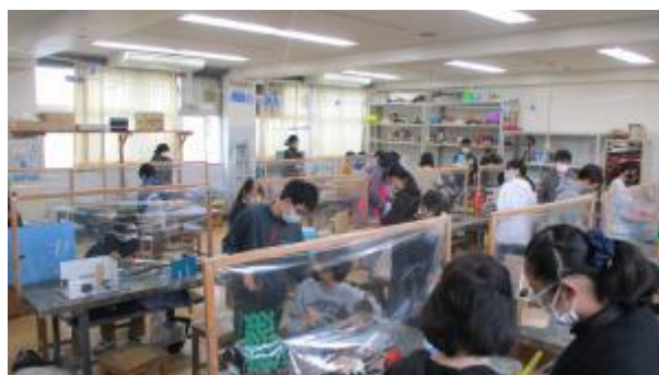
1校時 6年図工の授業 公開中