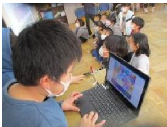
スクラッチでプログラムしたものを発表しているところ