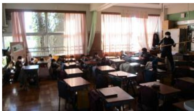
訓練とはいえ、不安そうに身をひそめる3年生