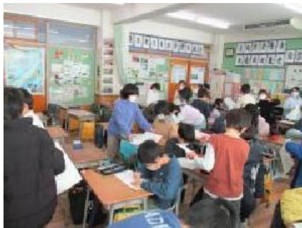
どんどんカードを交換していきます♪