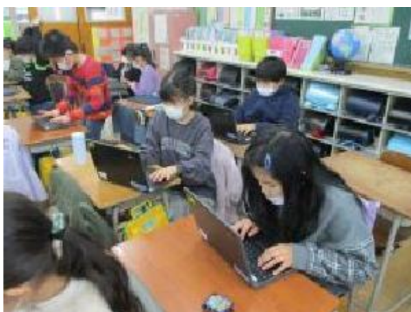
操作がさらに上達している子供たちです☆