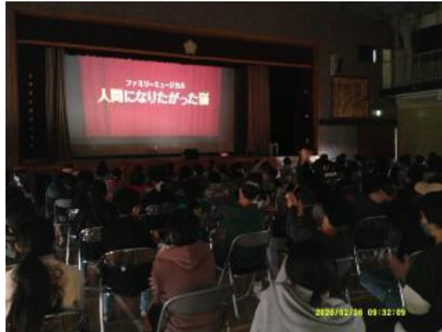
鑑賞中の児童の姿