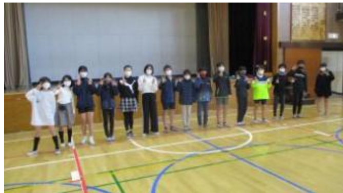
がんばれ 馬込代表！