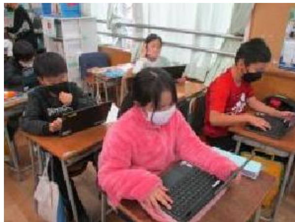
集中して取り組んでいます！

3組では、総合の学習として「大森麦わら細工についてまとめよう」に取り組みました。Google スライドを活用して、これまでの学びをアニメーションやレイアウトを工夫するなどしてまとめています。大森麦わら細工の特徴や歴史、郷土博物館の学芸員さんから教わったこと、実際に作ってみた感想など、内容がどんどん充実するよう、集中して取り組んでいました。完成が楽しみです！！