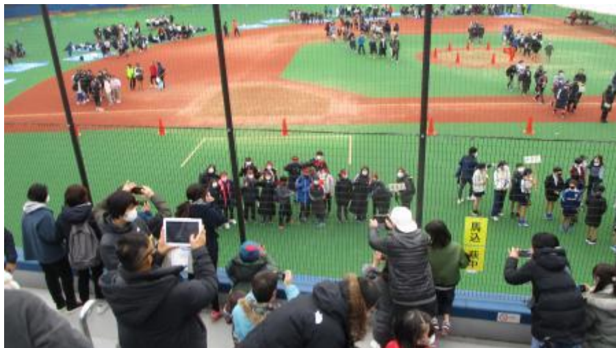
応援、ありがとうございました！

正式な記録は後日となりますが、ゴール目の競り合いの中、見事4位に入ったかな？ と思われます。タイムもよかったような感じです。 これまで苦しい練習を乗り越えて今日の舞台に立った子どもたち。今日、満足そうな表情でレースを終えられたことが何よりです。