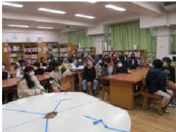
新しい図書室をキョロキョロ

先週から新しい図書室が開館し、本日は冬休みの貸し出しを行いました。 まず棚の位置の説明を聞いて、早速借りたい本を吟味…。 それぞれ選んだ本を借りて、静かに読書しました。 集中して読んでいました。冬休みもしっかり読書に取り組んでもらいたいです(^^)