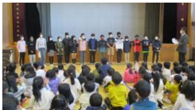
駅伝の記録は 32 分 20 秒。昨年度を上回る好成績