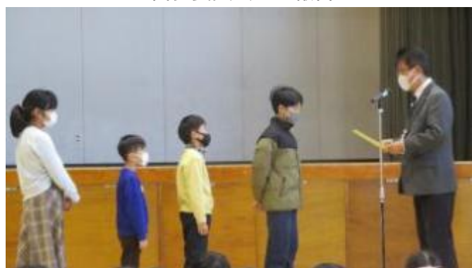
剣道の表彰 立派な成績です！