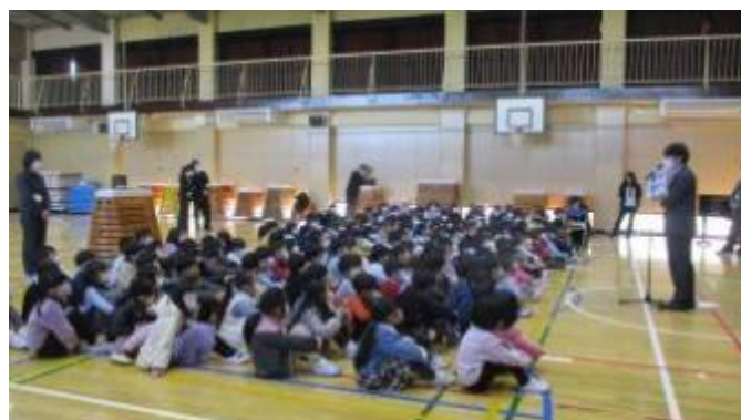
生活指導の先生から