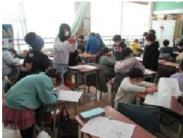
次はだれに言葉を贈ろうかな・・・