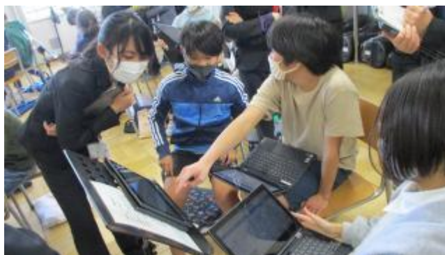
小グループをあちこち回ってアドバイス