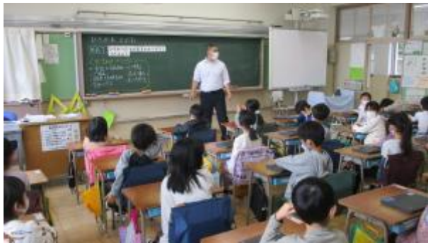
1年3組の事前研究授業(11月29日)