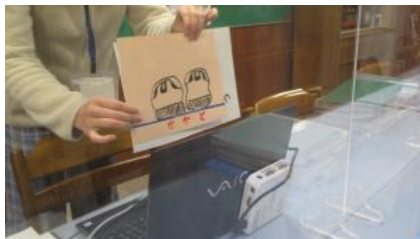
かかとはこんな風に