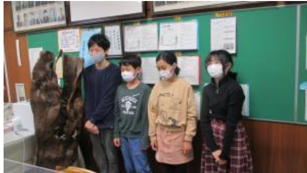
あいさつ当番の 6 年生