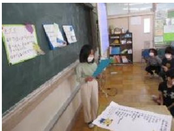
自分の好きな「鳥」について発表しているところ

今日は、2年2組で学期末のお楽しみ発表会が行われました。今回のお楽しみ会は、2学期に自分ができるようになったことや、得意なこと、みんなに見せたいものなどを一人一人発表する会でした。なわとびで連続してとべるようになった、跳び箱がとべるようになった、習い事で練習しているダンスを発表したい、など一人一人が頑張っ発表していました。できるようになった喜びや、得意なものに対するあこがれを素直に口にする姿が見られました。