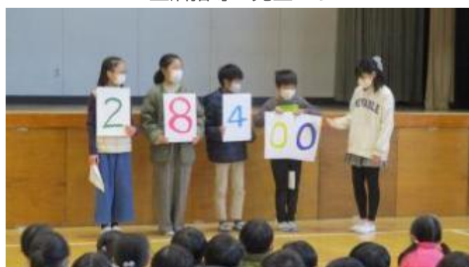
代表委員会から報告