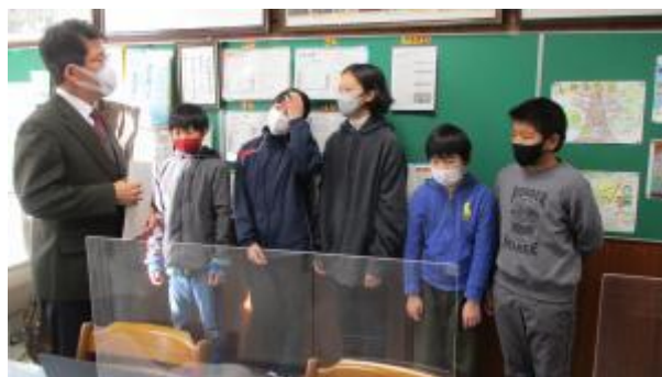
人権啓発作品展の表彰

次に大田区の「人権啓発作品展」出展の 6 名の表彰です。 毛筆書写(習字)部門、ポスター部門、標語部門に作品を出展しました。 みなさんおめでとうございます。