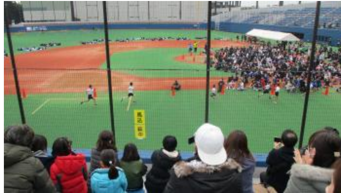
スタンドから応援

正式な記録は後日となりますが、ゴール目の競り合いの中、見事4位に入ったかな？ と思われます。タイムもよかったような感じです。 これまで苦しい練習を乗り越えて今日の舞台に立った子どもたち。今日、満足そうな表情でレースを終えられたことが何よりです。