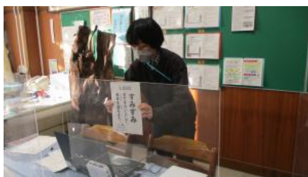
すみずみまできれいにして新年をむかえよう

校長先生のお話は、「馬込家庭学習 DX」について。校長先生はいつも「長いお休みは自分らしさを磨く期間」と言います。 自分の時間、家族と過ごす時間を上手に使って、ほかの人とは違う自分らしい生活をする事が多くなります。DX についても同じこと。今日配られる「冬休みも！！馬込家庭