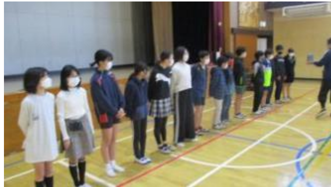
一人ずつ自己紹介

今日は臨時の放送朝会を行い、全校児童に駅伝大会のこと、馬込小学校代表選手のことを 紹介しました。みんなで応援する壮行会です。 皆さんの活躍を、馬込小のみんなが期待しています。全力で走り抜けてくださいね。