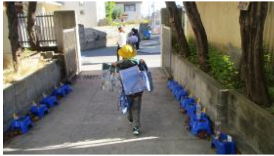
荷物多めの子、気を付けて