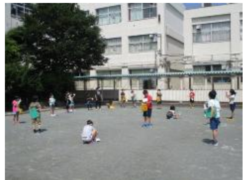
4年生は校庭の気温を測る学習をしました。