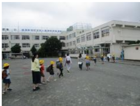
地域別に、間隔をとって、並んで帰りました。