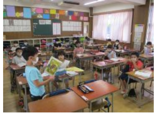
1年生 気持ちを込めて音読していました。