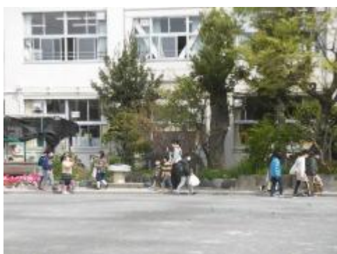
新4年生には育てていたシクラメンも渡しました。