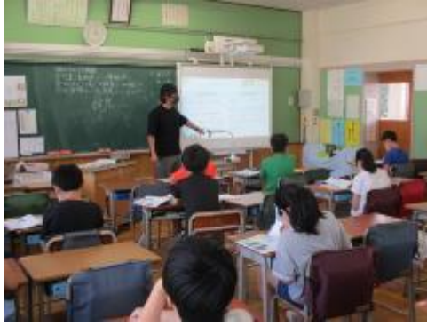
5年生は「領土をめぐる問題」を学習中。