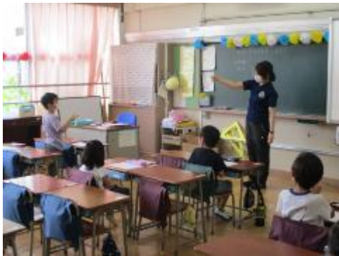
先生とじゃんけん5回戦「5はいくつといくつかな？」

分散登校期間中、どの学年も授業は2時間。短い時間を有効に使って、学習を進めています。1年生は「おはじきげえむ」を通して「5はいくつといくつ」の学習をしていました。6年生は国語の物語文「帰りの道」。登場人物の気持ちを心情曲線に表して考えていました。給食は2日目。「こぎつねごはん」と「さつま汁」。みんな、おいしそうに食べていました。