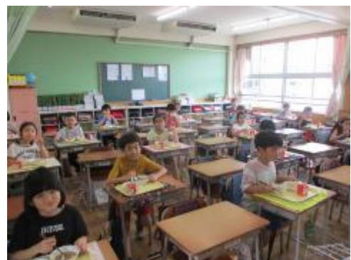
3年生の給食の様子です。