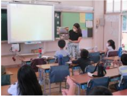
2年生 たんぽぽのちえを学んでいます。