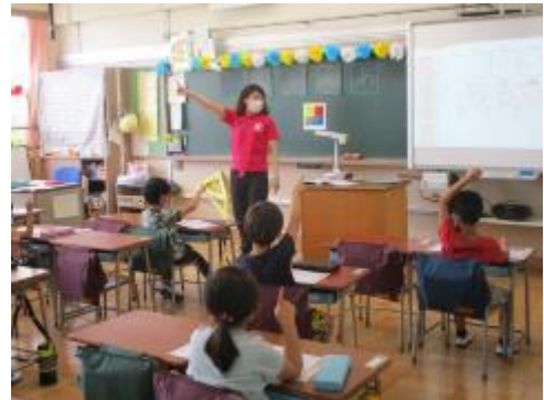
1年生はひらがなの書き方の学習をしました。