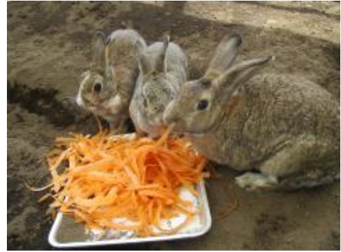
3羽のうさぎさん。元気で食欲旺盛です。