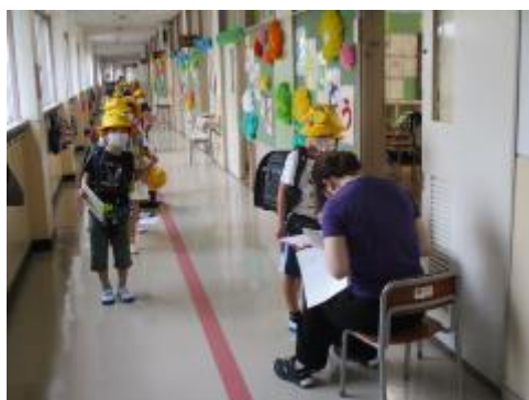
教室に入る前に、健康確認をしています。