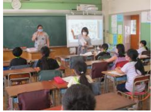
5年生は外国語の授業も始めました。