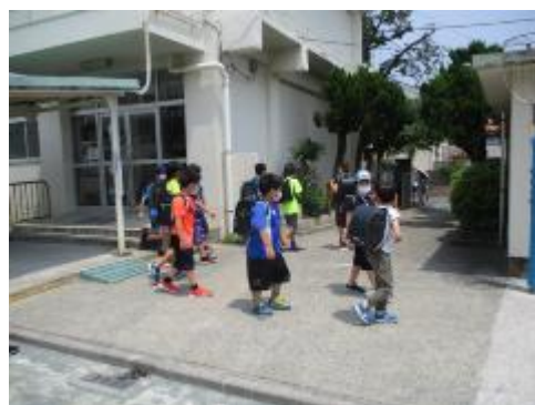
みんな元気に帰っていきました。