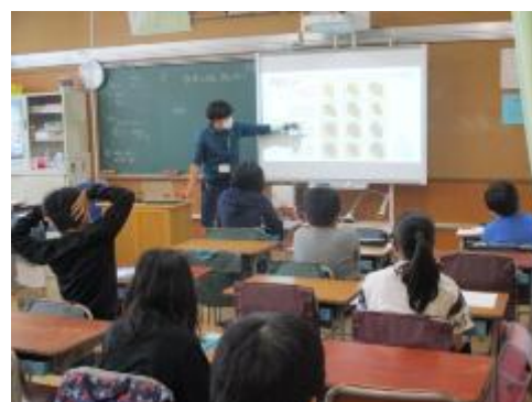
6年生 植物の成長と日光のかかわり