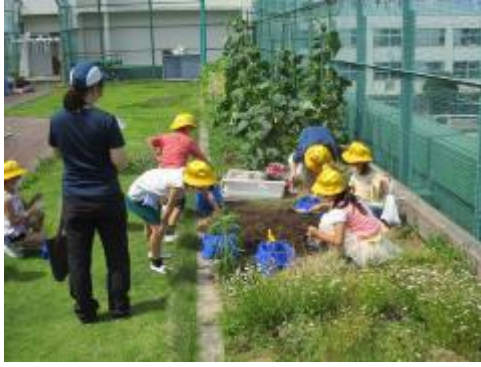
2年生はミニトマトの種を植えました。