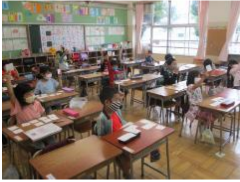
1年生 8はいくつといくつ