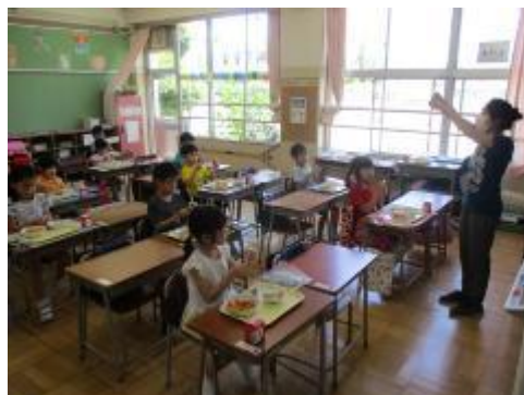
1年生はストローのむき方も覚えました。