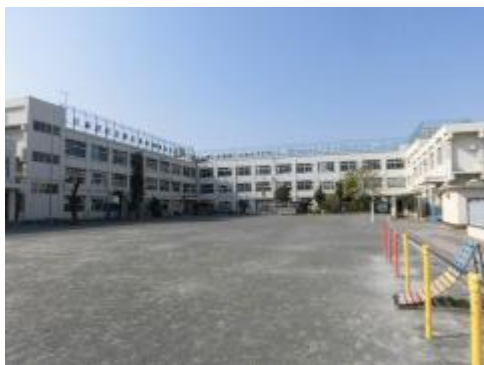
子供たちのいない校庭は寂しいです。