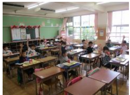
1年生給食 全員が「おいしかった！」