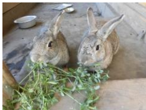
マロンとチョコはとっても元気です。