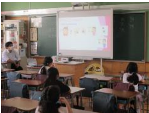
養護の先生が作ってくれた新型コロナウイルスについての動画を全学級で見ました。