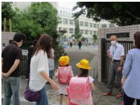
校門で元気にあいさつして登校です。

今日は1年生登校日。かわいい1年生たちが3分の1ずつ、分散して登校してきました。初めての教室で、担任の先生のお話をしっかり聞いていました。終わった後に尋ねたら、「とっても楽しかった!」と言っていました。