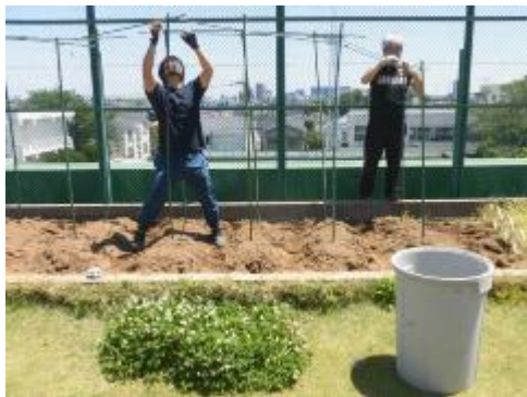
胡瓜が大きく育つように、支柱を立てました。