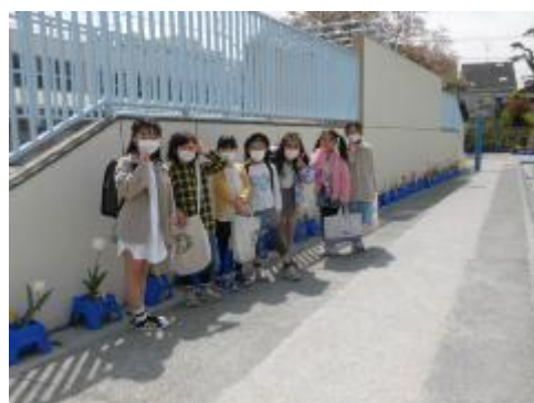
新2年生が育てたチューリップもきれいに咲いています。