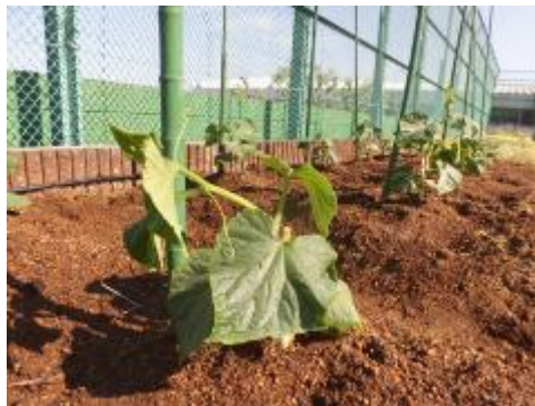
馬込半白胡瓜の苗です。