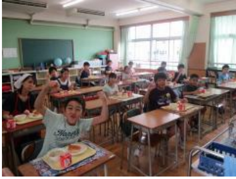
5年生の給食の様子です。