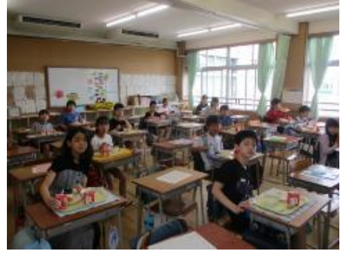
6年生の給食の様子です。