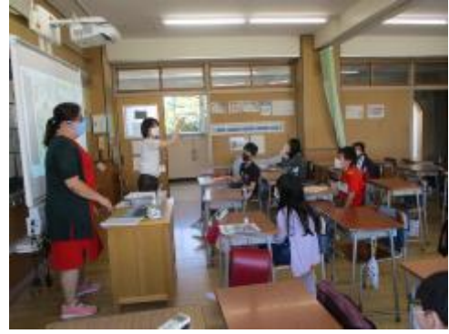
6年生は職業等を表す英語を学習中。