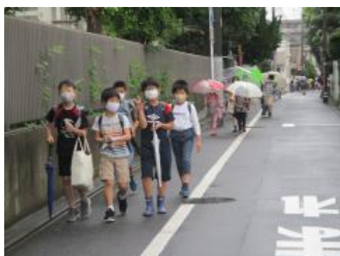
雨にも負けず、元気にあいさつして登校。

今日で分散登校は終了です。登下校の時刻をはじめとした様々な対応へのご協力、改めて感謝申し上げます。来週22日（月曜）からは、全員が通常通り（8時15分～25分）の登校となります。26日（金曜）までは給食ありの午前授業。27日（土曜）は3時間（給食無し）の土曜授業と6日間続きます。朝からの登校も本当に久しぶりとなります。健康管理等、よろしくお願いします。