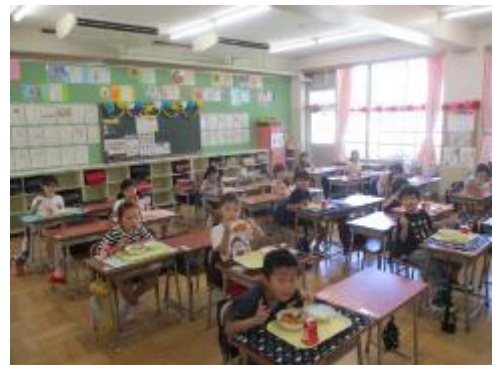
1年生。ナポリタンに大喜び。