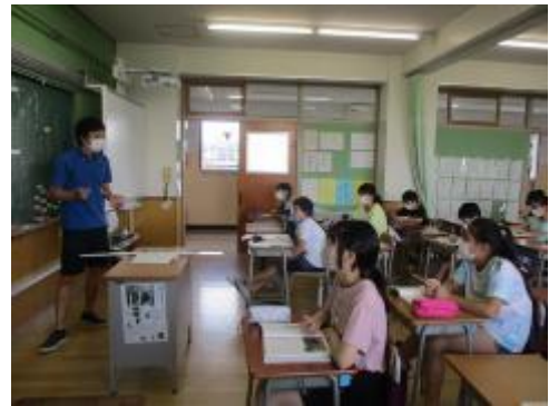
主人公の気持ちはどれくらいだろう？