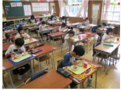
1年生給食 もりもり食べていました。