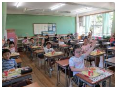
4年生もみんな「おいしかった」と喜んでいました。