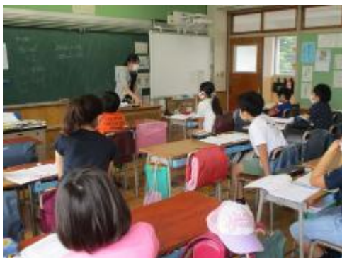
5年生 立方体の体積