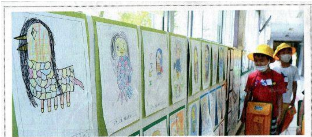
廊下に飾られた児童らのアマビエの絵（29日、大田区立馬込小学校で）