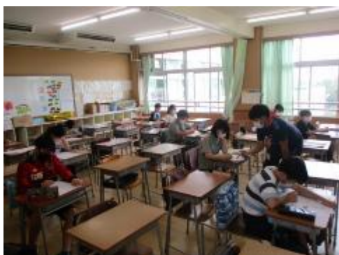
6年生は算数のワークテストに取り組んでいました。