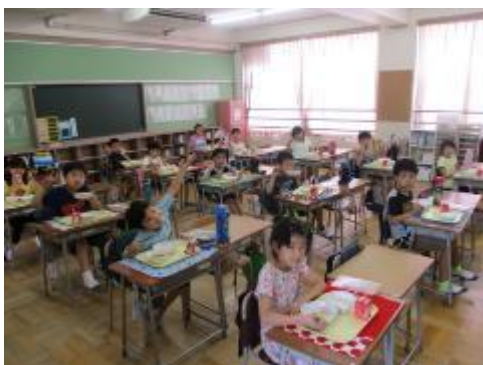
2年生の給食の様子です。