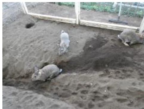
うさぎさんは3羽とも元気です。