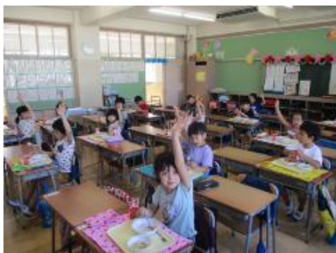
1年生は「おいしかった！」とみんな手を挙げていました。