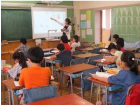
3年生 物語文「まいごのかぎ」

今日もみんなしっかりと勉強していました。明日が分散登校最終日です。雨の中の登下校となりそうですので、安全への声掛けをお願いいたします。