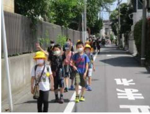
暑さに負けず、元気に登校です。