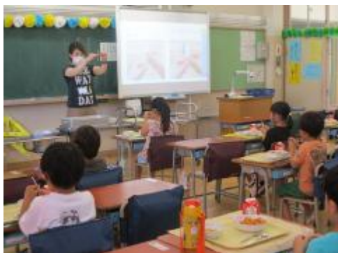
1年生は給食の準備の仕方から勉強です。

今日から、待ちに待った給食が始まりました。1年生にとっては初めての小学校給食。2～6年生にとっても3か月ぶりの給食。今は子供たちによる配膳ができないため、地域のボランティアの方々にもご協力いただき、時間内に行うことができました。子供たちも（先生たちも）、おいしい給食にとっても喜んでいました。