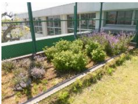
セージ、レモンバーム、セージも元気に育っています。