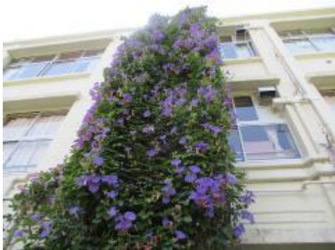
「野朝顔」が見事に咲いています！

今までの分散登校時における様々な対応に、改めて感謝申し上げます。今後も感染症予防対策を講じた上での教育活動となりますので、引き続き、マスクの着用をはじめとした予防対策へのご理解とご協力をお願いいたします。