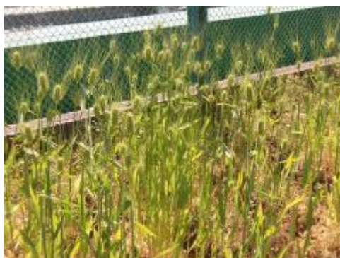
4年生の麦も穂を付けています。