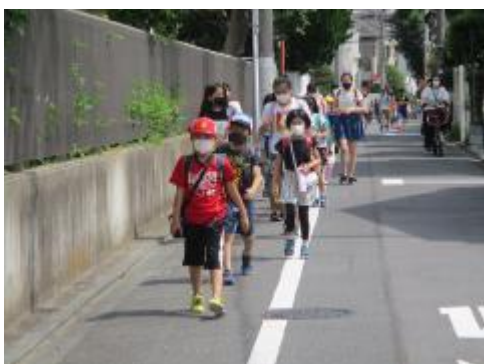
今日も元気に登校です。

今日も2グループに分かれての分散登校。みんな、登校時刻に合うようにうまく調整して登校してくれました。どの学年も、落ち着いて学習に取り組んでいます。明日からは、いよいよ待ちに待った給食も始まります。持ち物の確認等、よろしくお願いいたします。