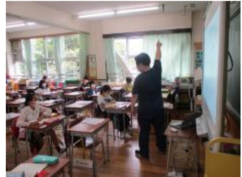
4年生 漢字辞典の使い方