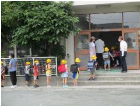
1年生は上履きの履き替えに手間取っていたようでした。

今日から、各学級2グループに分かれて毎日登校という形での分散登校になり、みんな元気に登校してきました。前半のAグループの登校時刻は9時40分から45分、後半のBグループの登校時刻は12時35分から40分。今日は、初めてということもあり大分早く来てしまった子供もいました。登校時刻にうまく到着するようにご協力をお願いします。また、学校での授業は2時間しかありません。引き続き、家庭学習との両輪で学習を進めていきます。ご理解とご協力をお願いいたします。