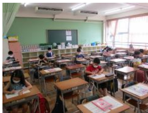
3年生は社会のプリントに取り組んでいました。