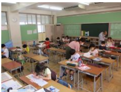
2年生は漢字ドリルに取り組んでいました。

今日は、分散登校5日目。3グループでの学年登校は本日が最終日でした。今日は2, 3, 6年生の登校日。各学年、学習課題の確かめ等の学習に静かに取り組んでいました。来週からは、2グループの分散で、毎日の登校となります。暑い日が続きます。この週末、体調を崩さずに、元気に登校できるように気を付けてください。なお、馬込小YouTubeチャンネルには、来週配布する「なわとびカード」の技の紹介動画をアップしています。馬込小体育部の先生方がなわとびを跳んでいます。ぜひ、見てみてください。カードを配るのは来週ですが、早速、挑戦してみてください。