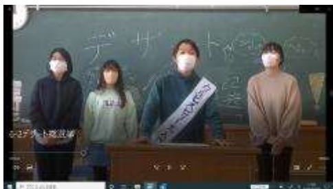
カルピスゼリー党

6年生による「馬込小をよりよくなる活動」。6年2組のみんなは「デザート総選挙」を行い、馬込小を盛り上げようとしてくれています。今日は、各デザート党の演説動画を全クラスに配信してくれました。これを見た全校児童が投票を行います。どのデザート党が当選するのか、とっても楽しみです。