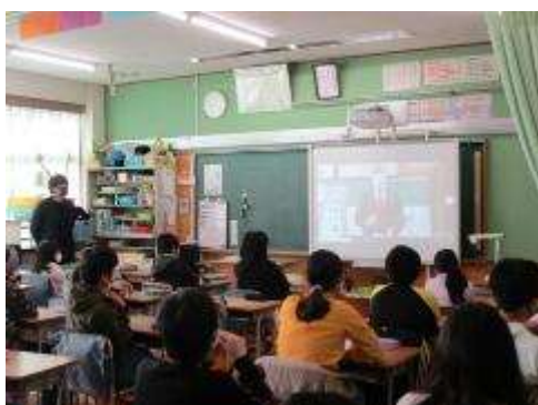
各教室で観ました