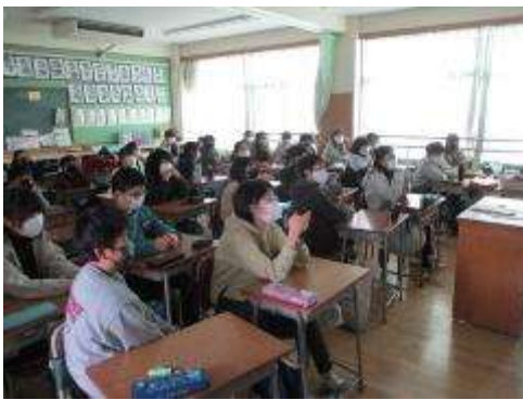
教室で観ている6年生