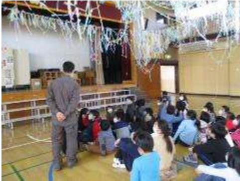
1月25日(月曜)の給食 全国学校給食週間