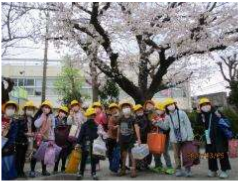
満開の桜の下に集ってもらいました。