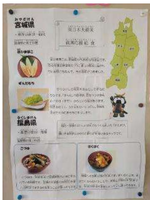
3月10日(水曜)の給食 東日本大震災復興支援給食(岩手県)