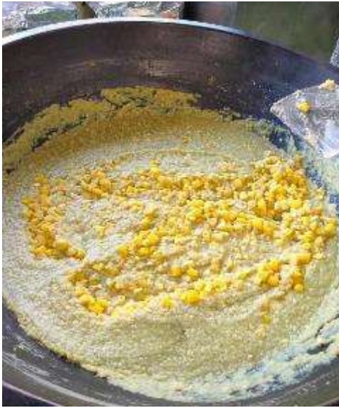
栗の甘露煮も入っています。