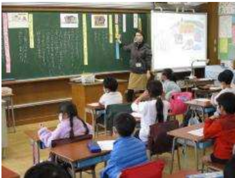
1 年生 ともだちをたすけたゾウ

土曜授業を行いました。今回、道徳授業の公開はできませんでしたが、各学級、毎週欠かさず、道徳授業を行っています。様々な立場の人や動物の行動や言葉について考えることを通して、「生き方」についての考えを深めています。