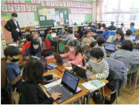
3年生 パソコンを使った国語の学習