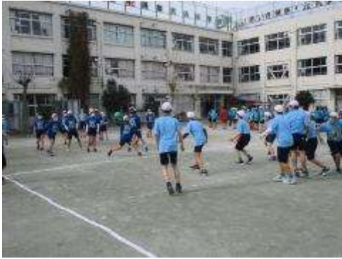
ドッジボール 男子