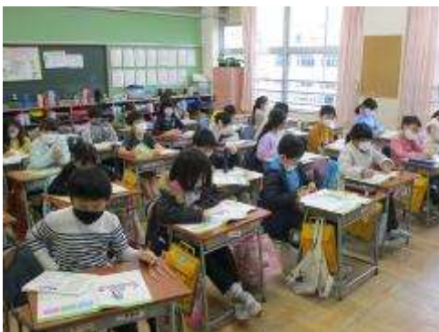
2年生 SNS 東京ノートを使った学習