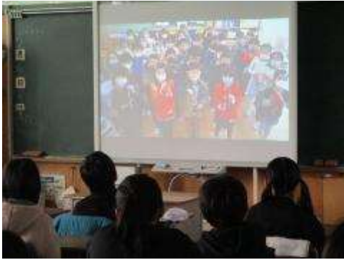
教室で観ている6年生