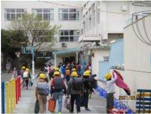
新学期まで元気でね！