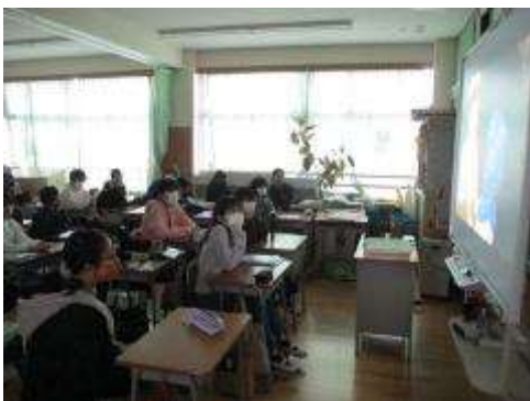
6年生 社会のまとめとして戦時下のビデオを鑑賞