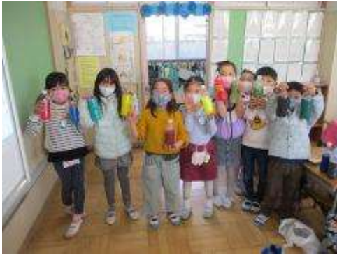
2月10日(水曜) 給食の掲示物