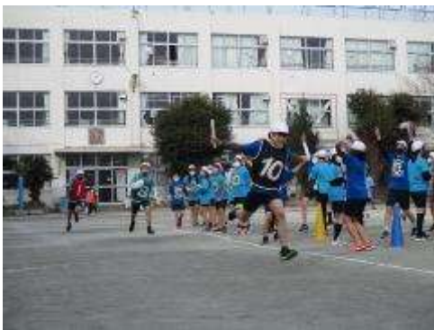
男女混合クラス対抗リレー