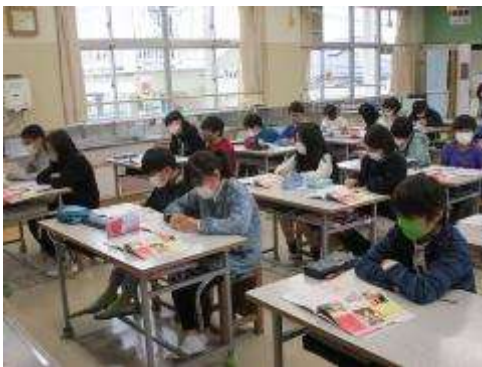
5年生 家庭科「家族でいっしょにホットタイム」