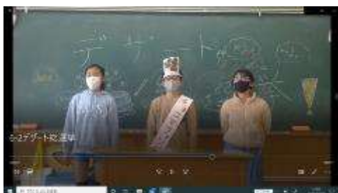
チョコマフィン党