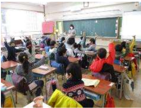
担任の先生のお話の様子 1年生の教室