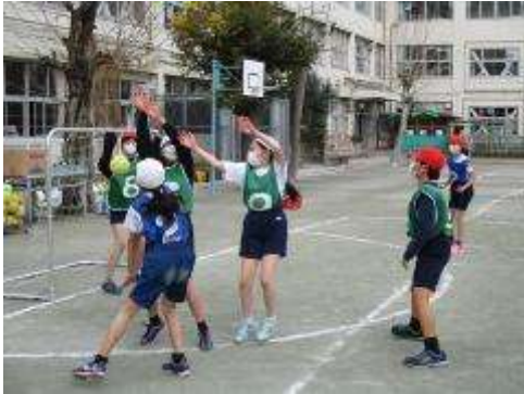
5年生 ハンドボール