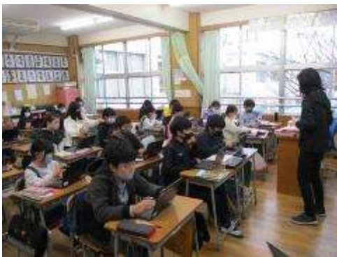
4年生 パソコンを使った国語の学習