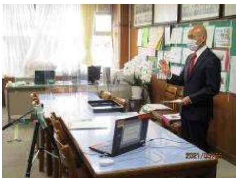
校長室からの放送