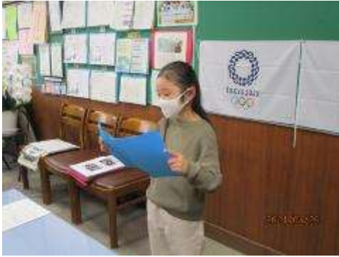
児童代表の言葉 2年生