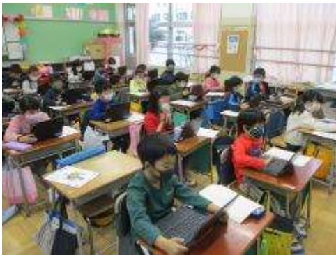
1年生 パソコンを使った算数の学習

土曜授業を行いました。あいにくの雨でしたが、みんな落ち着いて学習に取り組んでいました。各学年、ノートパソコン(クロームブック)も有効に活用し、各教科の学習に落ち着いて取り組んでいます。