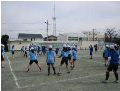
ドッジボール 女子