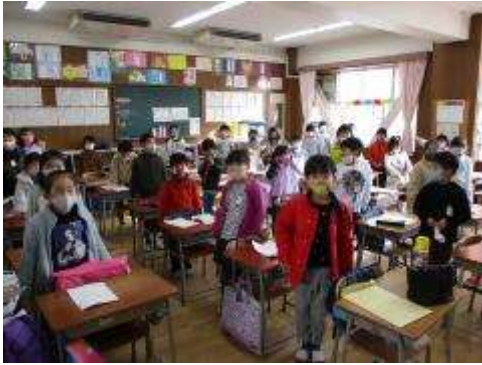
新年のあいさつ 1年生の教室