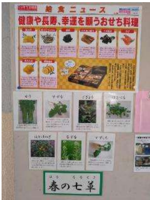
春の七草わかるかな？