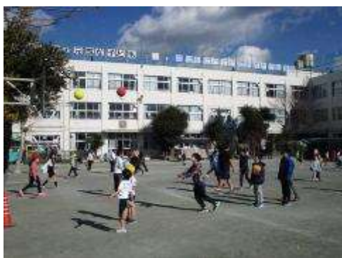
休み時間(校庭、体育館、屋上に分かれて遊んでいます。)