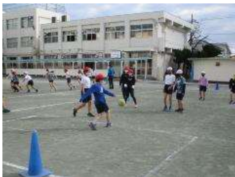
4年生 ミニサッカー

昨日と違って変わって寒い一日でしたが、子供たちは寒さに負けず元気に活動しています。体育のボール運動では、4年生はミニサッカー、5年生はハンドボールに取り組んでいます。