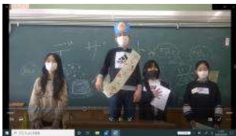
フルーツポンチ党