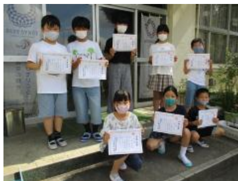
漢字能力検定合格者代表児童