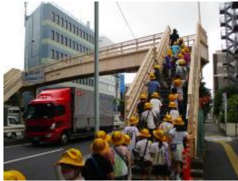
蛇坂下にある環七歩道橋