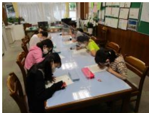
校長室でのわり算検定