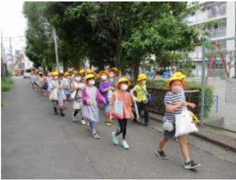
南馬込1丁目児童公園横

「こんなところ知らなかった。」「今度はもっとゆっくり遊びに来たい。」など、地域のことを知るとって もい機会になったようでした。