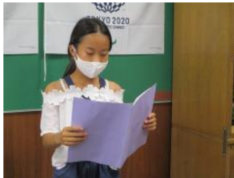
3年生児童代表の言葉