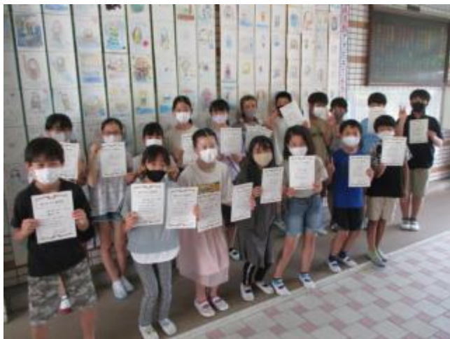
体カテスト男女別上位入賞者

今朝の全校朝会では、体カテスト（50m走、20mシャトルラン、ソフトボール投げ）の全校男女1～3位までの表彰を行いました。今後も体カづくりに励んでほしいと思います。写真は表彰メンバーです。