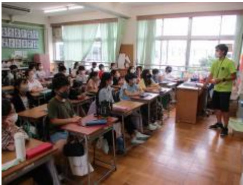
1組 総合的な学習の時間

雨のため、5年生は予定していた遠足に行けませんでした。しかし、学校で1日しっかりと勉強しました。また、校長室での「わり算検定」にも合格目指して頑張って取り組みました。