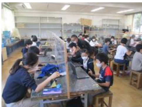
5年生 ムービープロジェクト