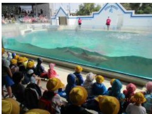
イルカってすごい！