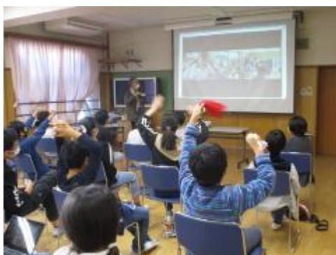
お互い大盛り上がりでした。