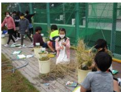
稲を刈っています

5年生が学校の屋上で大切に育ててきた稲。今日は、稲刈りをして、束ね、天日干しにしました。自分たちの育ててきたお米がもうすぐ見られます。