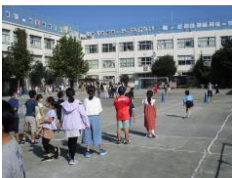
屋上では、しっぽとりや大なわとびなど 校庭では、リレーや鬼ごっこや大なわとびなど