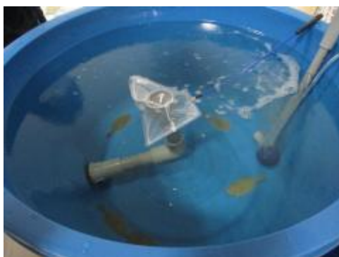
かわいいヒラメさんたち