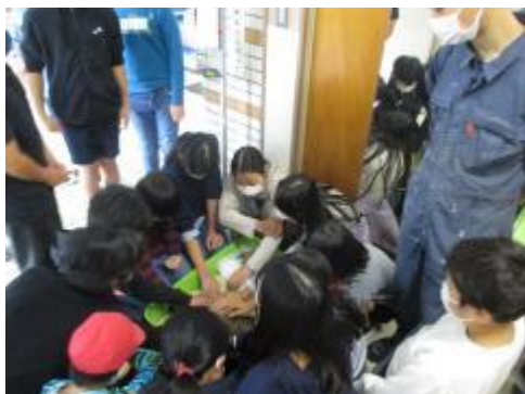
飼育委員のみんなと

飼育委員会の子供たちをはじめ、全校のみんなで大切にしてきたうさぎのチョコが、今朝早く、天国へ旅立ちました。中休みには飼育委員会の子供たちと、放課後には全校の子供たちと、安らかに眠ってくれることを祈って、お別れしました。