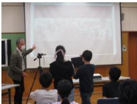
相手校からの反応があります