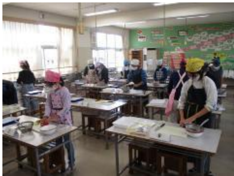
できた野菜はお弁当箱に詰めて