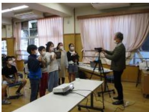
What comic do you like ?