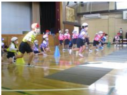
思いっきり走りました