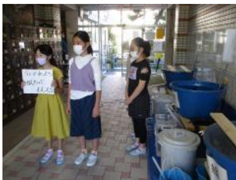
みんなへの呼びかけ