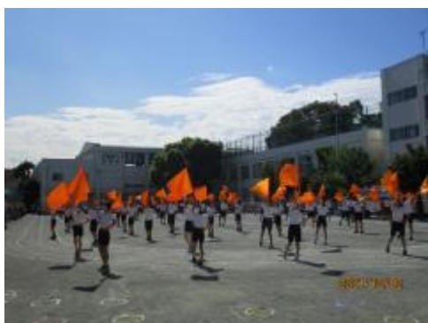
6年生 Wind Flags

青空の下、運動会を行うことができました。たくさんの保護者の方々にご参観いただき、ありがとうございます。今までの練習の成果をしっかりと観ていただき、子供たち一人一人、充実感・達成感を得ることができたことと思います。また、たくさんのPTA・おやじの会の方々にお手伝いをいただき、ありがとうございました。今後とも、教育活動へのご理解とご協力のほど、よろしくお願いいたします。