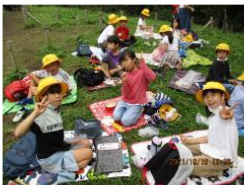
お弁当はおいしい！