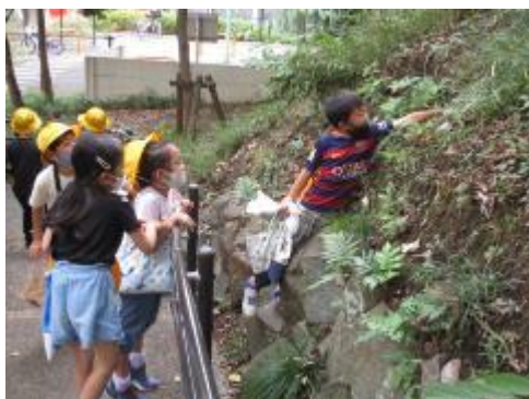
どんぐり見つけたよ

2年生の生活科「秋を見つけよう」。今日は、歩いて本門寺公園まで行き、どんぐりや松ぼっくり、落ち葉を見つけてたくさん拾ってきました。その後、公園でたっぷりと遊んでから帰ってきました。午後には、拾ってきたどんぐりなどを使って、絵を描いたり、どんぐりコマを作ったりしました。たくさん歩いて、たくさん歩いて、それでもまだまだ元気な子供たちのパワーに驚かされました。