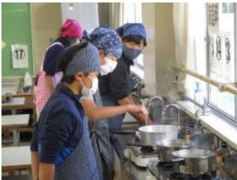
ゆで具合はどうか？

コロナ禍でできなかった調理実習。緊急事態宣言も解除され、グループ調理でなく個別調理にするなど、対策を講じて実施しました。実際に食べる初めての調理実習に、子供たちは緊張しながらも、とっても嬉しそうでした。教室で、黙って食べながらも、自分で作った調理のおいしさに、思わず笑みがこぼれていました。