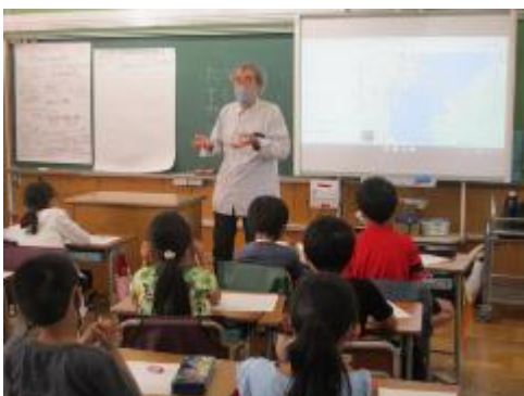
3年生 馬込はかせになろう