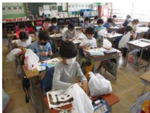
楽しい絵になりました