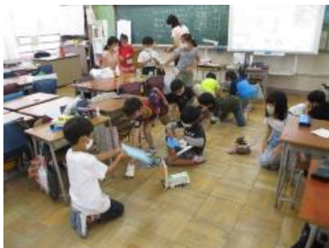
2年生 うごくおもちゃであそぼう