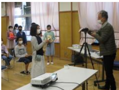
好きなものの紹介

オンライン国際交流。今回は、6年3組の子供たちがオーストラリアのブリスベンにある小学校の子供たちと交流しました。5つのテーマ（スポーツ、フード、アニマル、ビデオゲーム、コミック）ごとに、一人一人が自分の好きなものを伝え合いました。どちらの学校も大きく盛り上がり、最後には、お互いの校歌を歌い合いました。同じ世代の外国の子供たちと英語を用いた交流学习。子供たちの豊かな未来につながってくれることを願っています。