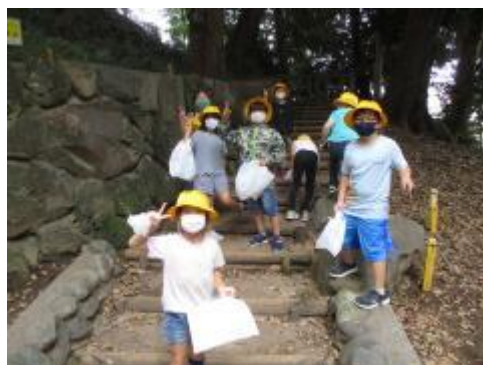
たくさん拾えました