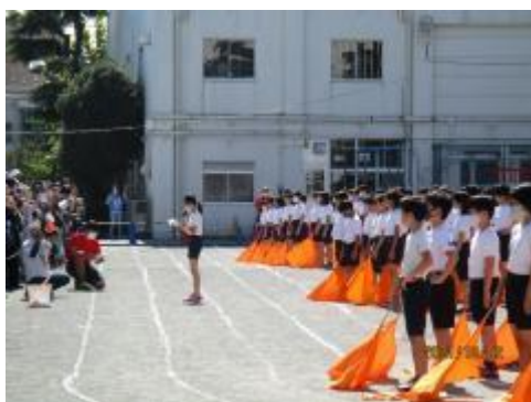
6年生 終わりの言葉