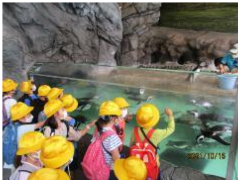
ペンギンさんかわいい！