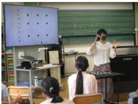
トーンチャイムの使い方

今日は、初めて「トーンチャイム」を使いました。初めて見る、聴く楽器に子供たちは興味津々。4つのグループに分かれ、1グループずつ順番にトーンチャイムを使い、後のグループはリコーダーを吹き、ジュピターの合奏に挑戦しました。段々とうまくなって、きれいな音色が音楽室に響きました。