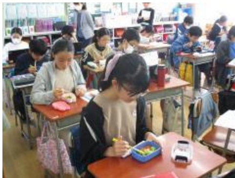
教室で黙って食べました。「おいしい！」