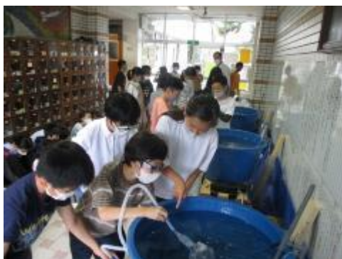
掃除の仕方の確かめ