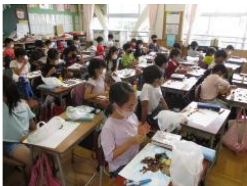
どんぐりをどうしようかな