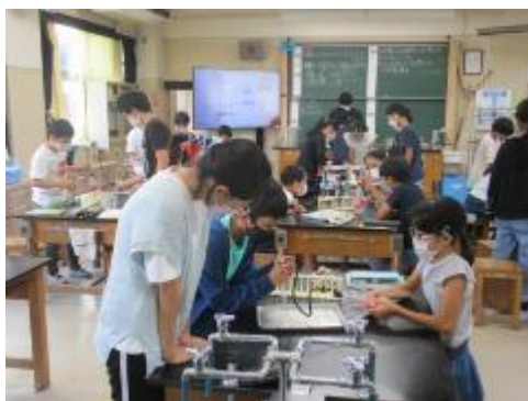
6年生 炭酸水には何がとけているのだろう