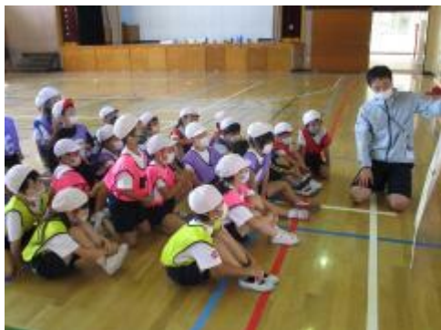
みんなで今日のめあてを確認

今日は「リレー遊び」に取り組みました。段ボールの障害物を置いて、チームで競って走りました。段ボールの置き方を考えたり、バトンの上手な渡し方を意識したり、みんな一生懸命取り組んでいました。