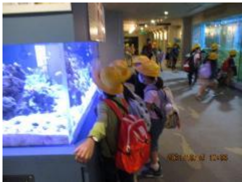
いろいろな魚がいるね！