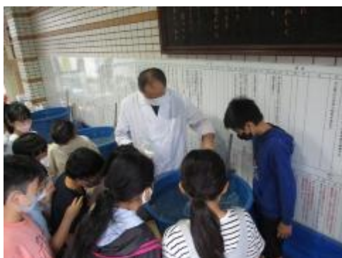
エサを食べる様子の観察