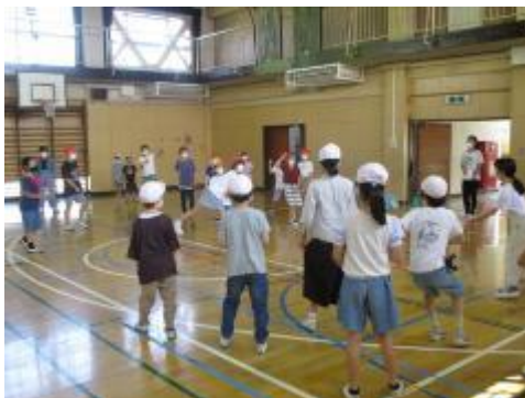
教室では、風船バレーやジェスチャークイズなど 体育館ではドッジボール