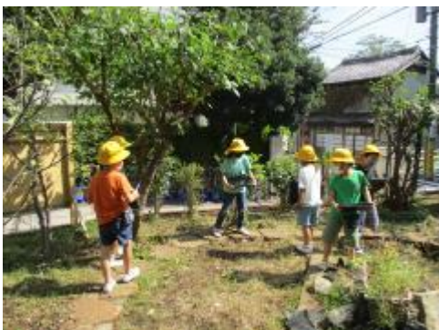
1年生 あきとなかよし

運動会で全力を尽くしてがんばった子供たち。今日から、通常時間割の日々に戻りました。各学年、それぞれの学習にしっかり取り組んでいました。