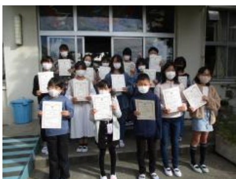
表彰された子供たち

今日の全校朝会では、池上警察の方による交通安全のお話の後、大田区小学校連合図工展の表彰を行いました。表彰された素敵な作品は、教員室前に展示しています。学校にお越しの際は、ぜひ、ご覧ください。