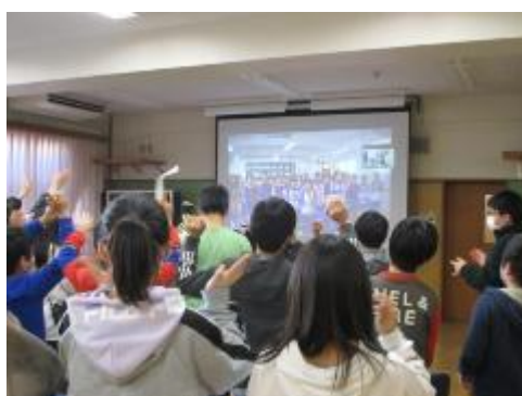
中国からもエールが届きました

今日の図工は「おつまみ図工室」。洗濯ばさみを使って、図工室を「つまみ」ました。上からぶら下げる子、下につなげて並べる子、入れ物などを飾る子、…。子供たちの発想には驚かされました。