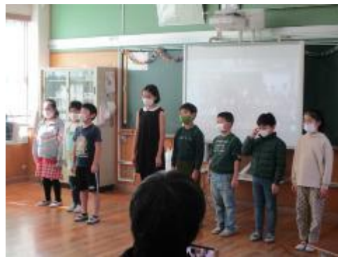
未来への HOPE !