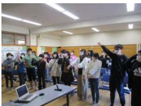
中国にエール 12月22日(水曜) 5年生 図工