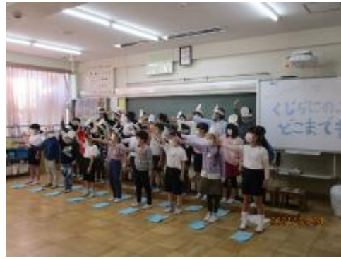
くじらにのって どこまでも