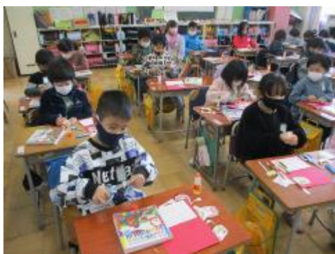
飾りと文を考えて