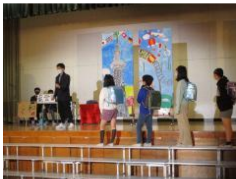
6年生「本当の宝物」 審査の結果は… 12月2日（木曜） 学習発表会リハーサル 1, 2年生

明後日（12月4日）のリハーサルに向けて、各学年、リハーサルを行いました。1, 2年生は教室での発表ですが、自分のセリフをしっかりと発表できていました。当日をお楽しみにしてください。