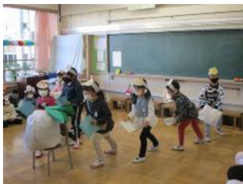
1年生「くじらにのって どこまでも」 動きにも注目です