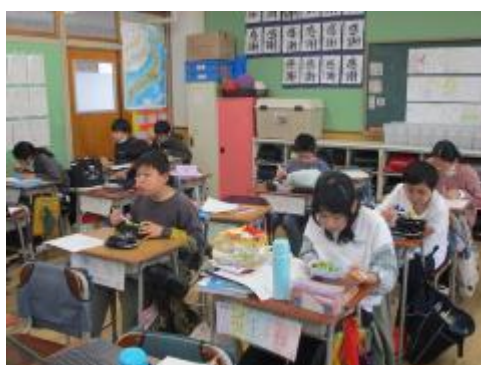
とっても美味しそうでした