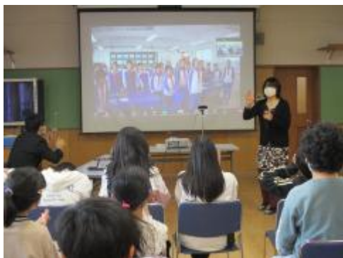
画面を通しての交流