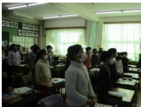
各教室から参加しました