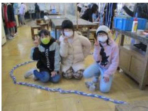
床に長ーく這わせたり…

今日の図工は「おつまみ図工室」。洗濯ばさみを使って、図工室を「つまみ」ました。上からぶら下げる子、下につなげて並べる子、入れ物などを飾る子、…。子供たちの発想には驚かされました。