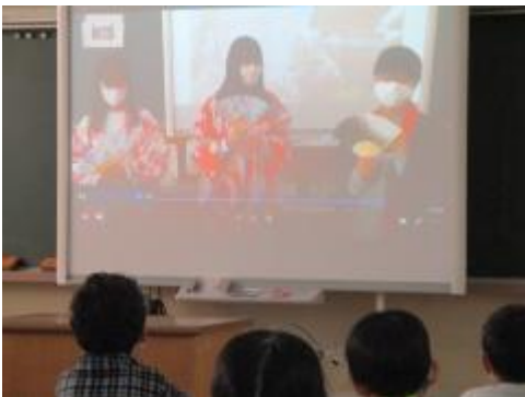
「学習発表会がんばろう集会」

今週の土曜日（12月4日）は学習発表会。朝の時間にも、「学習発表会がんばろう集会」を全校テレビ放送で行い、各学級、本番に向けた仕上げに取り組んでいました。3年生の「たんけん馬込！」の練習には、取材にもご協力いただいた大田区郷土博物館の学芸員の方にも観ていただきました。