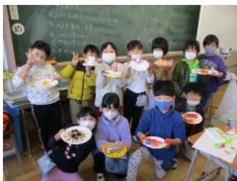
お皿に並べて完成！