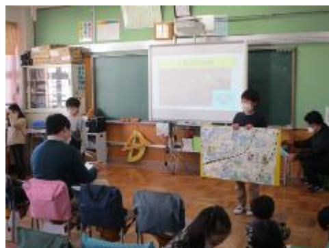
とっても詳しい発表です