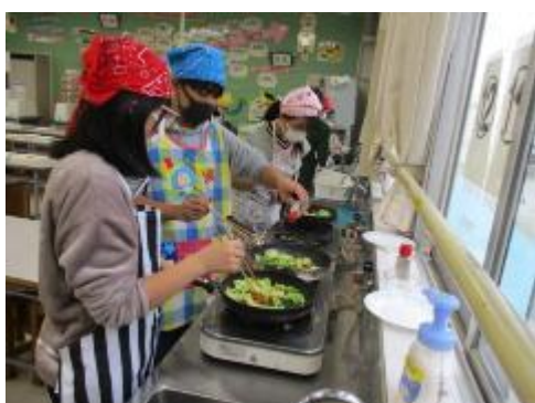
いい香りが漂って嬉しそうです