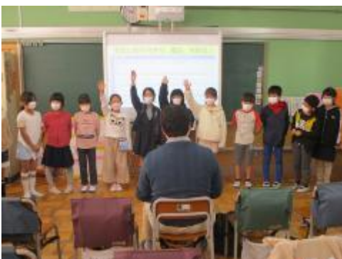
3年生「たんけん 馬込！」