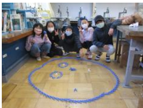
床で絵を描いたり…