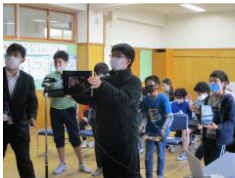
食べ物紹介グループ