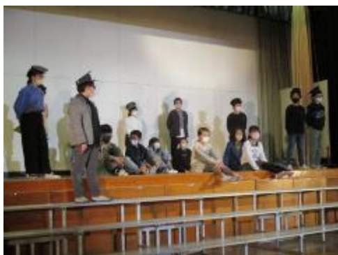
5年生「6年生ライセンス」

明日に迫った学習発表会。各学級とも、最後の練習に取り組みました。今日は、5, 6年生を紹介します。明日の保護者のみなさまのご参観を楽しみに待っています。