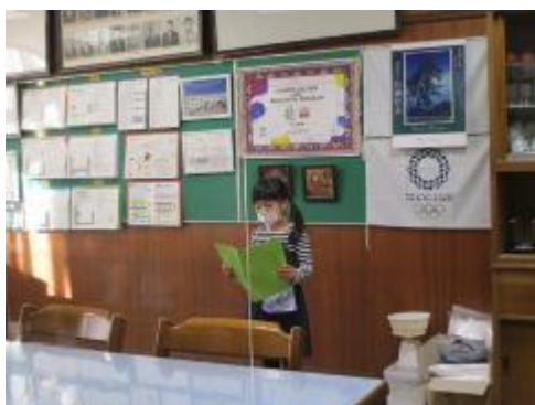
児童代表の言葉（1年生）