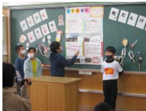
わくわくどきどき 町たんけん