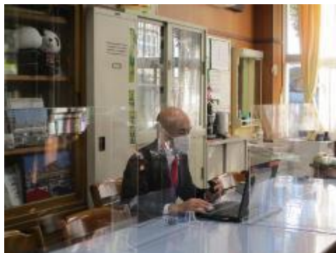
校長先生のお話（プレゼン）