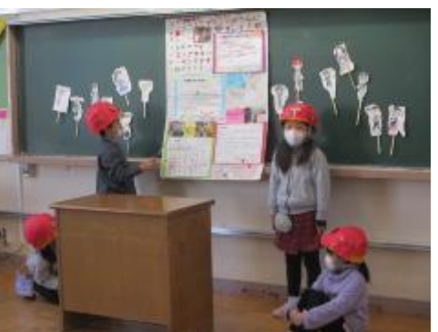
2年生「わくわくどきどき 町たんけん」 町たんけんの学習発表です