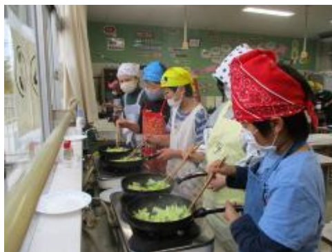
野菜のかさが減るのに驚いていました