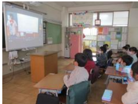
全校テレビ放送で参加しました