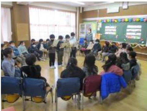
1組 司会グループが進行中

今日は、1年生各クラスでお楽しみ会を開いていました。校庭で「だるまさんがころんだ」や「ケイドロ」、室内で、「ばくだんゲーム」や「ハンカチ落とし」など、みんなとっても楽しそうでした。