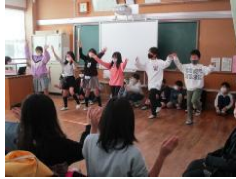
様々な見どころがあります