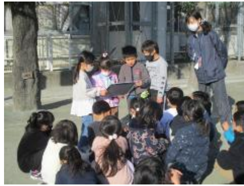
3組 ケイドロはじめ!