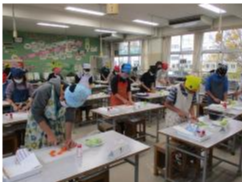
慎重に包丁を使っていました