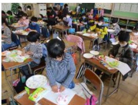
ごちそうを料理中

1年生の図工。紙粘土で、思い思いのごちそうを作る「ごちそうパーティー」やクリスマスに向けた「クリスマスカードづくり」に取り組みました。どちらもとっても楽しそうに取り組んでいました。