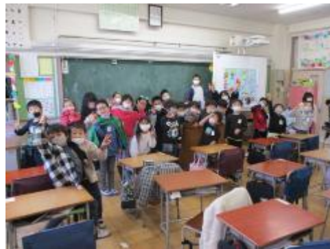
2組 パーティーが終わって