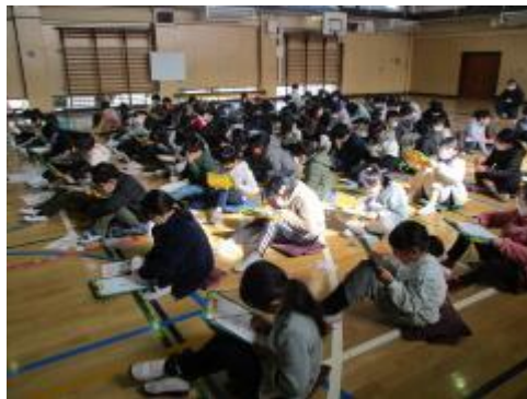
一人一人、考えたことをまとめました