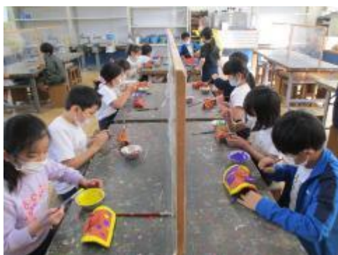
作品作りに没頭中

自分の家を守る風の子を、粘土に2色の色を付けて作りました。2色とは言え、色を作って選んだり、色の塗り方を工夫したりして、子供たちの思いのこもった、自分の家を守る素敵な作品が出来上がりました。