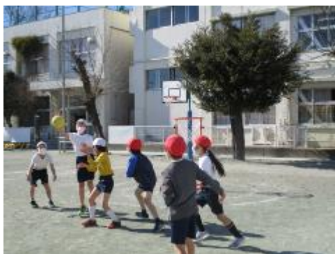
ボールの取り合いも白熱しています