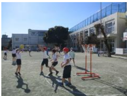
ゴールを狙ってシュート！