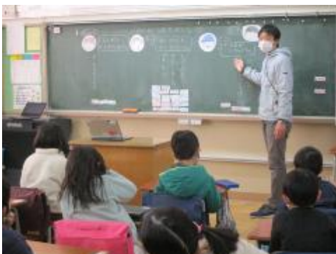
「かみひこうき大会」

新型コロナウイルス感染拡大のため、道徳授業の公開は中止とさせていただきましたが、本校では、「他の人とのかわりに関すること」に重点を置き、自信をもって活動する児童の育成つに努めています。