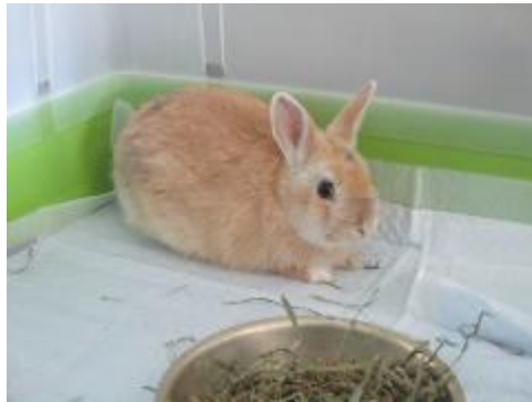
新しいうさぎさんです