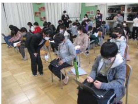
タブレットに感想を打ち込みました