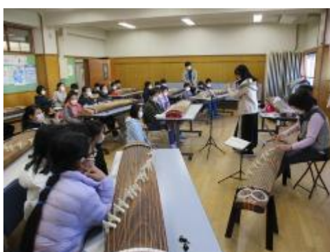
静かに聴き入っていました