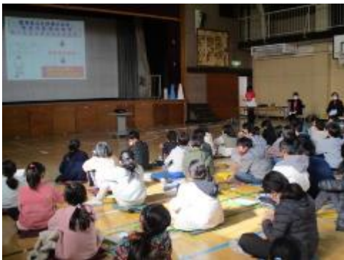
お話と疑似体験を通して学びました

大田区手をつなぐ育成会「心のバリアフリーすすめ隊」の方々にお越しいただき、障害理解出前授業を行いました。コミュニケーションが取りづらかったり、どうしていいかわからなくて困ってしまうことを知的障害の特性についてのお話と体験を織り交ぜながら学び、共に生きる社会について、みんなで考えました。