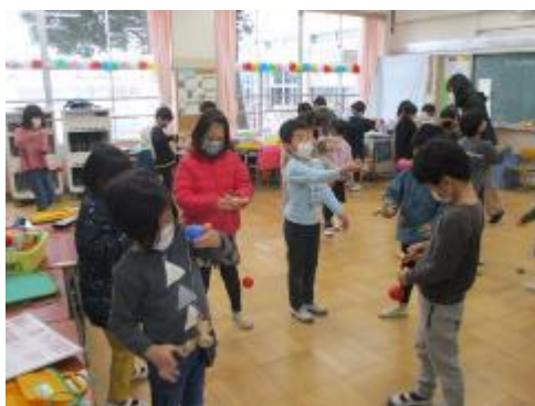
けん玉には苦戦していました

「おかしあそび」として、けん玉、あやとり、お手玉に取り組んでいます。やったことがある子もいますが、初めてやる子も結構いました。簡単にできないものも多いので、繰り返しやることで、それぞれの遊びの面白さがわかってくれればと思います。お家でも、ぜひ、挑戦してみてください。