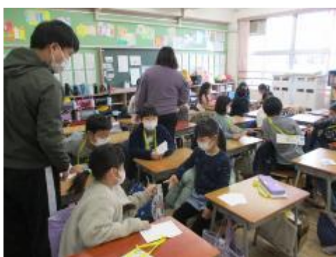
グループに分かれて挑戦