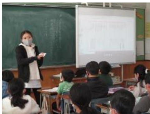
「心を結ぶ一本のロープ」