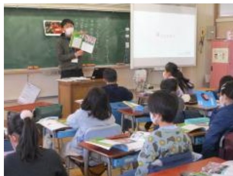
「だいじょうぶキミならできる」