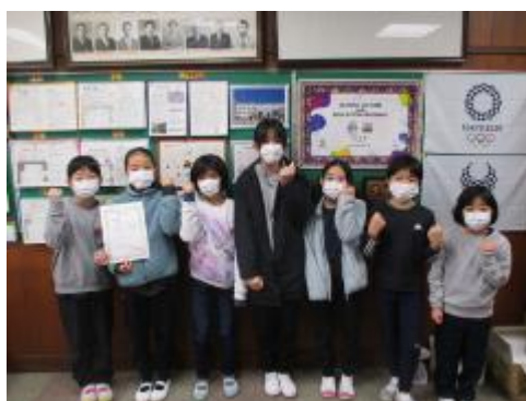
大田区小学生バレーボール大会