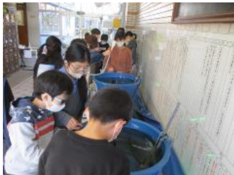
すごい勢いでエサを食べています