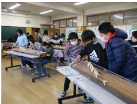
みんなで合奏しました