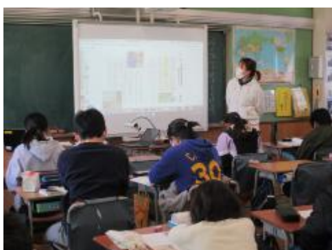
「命を預かる鉄道員の使命」