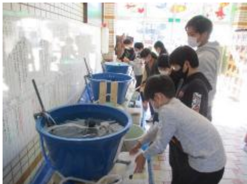
水の管理がとても重要です

10月から学校の正面玄関で育てているヒラメは順調に大きくなってきています。毎日の水槽掃除、フィルター洗浄、えさやり、子供たちと担任の先生が協力して、しっかりと取り組んでくれているおかげです。