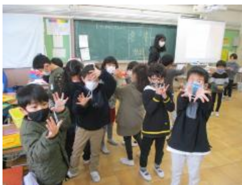
あやとりはいろいろとできていました