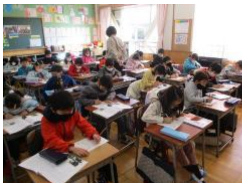
みんなよく考えていました