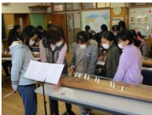
一つ一つ覚えました