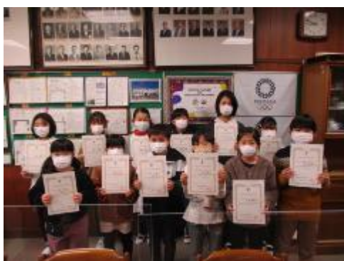
大田区小学校書き初め展

今日の全校朝会では、3つの表彰を行いました。（1）大田区書き初め展 （2）大田区小学生バレーボール大会 準優勝 馬込スピリッツ （3）ふれあい感謝状21（東京都において、児童・生徒の健全育成に多大な貢献） 優秀賞 スクールサポート馬込 馬込小にまつわる様々な活動が表彰されるのは、とても嬉しいことです。今後の活躍にも期待しています。