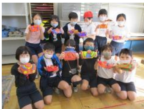
自分の作品にご満悦