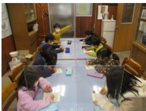
すごく早い子もいます