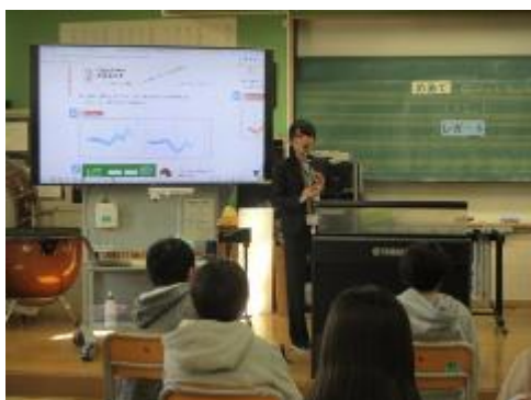
クラリネットの音を聴きました

「曲のいいところを見つけよう」。レガートの美しい「メヌエット」、弾むようなスタッカートが楽しい「クラリネットポルカ」。2曲を聴き比べて、いいところを見つけ、思ったことをタブレットに打ち込んで発表しました。「小鳥が歌っているよう…」「元気が出る感じがした…」など、とってもいい感想がたくさん出ました。