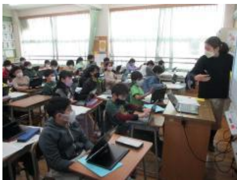
タブレット上にまとめることを聞き、

「ウナギのなぞを追って」。教科書から読み取ったことを、一人一人、タブレット上の地図にまとめました。「海での上流ってどっちだろう？」「どっちが小さいのかな？」…。教科書を読みなおして確かめながら、上手にまとめることができていました。