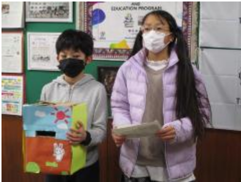
全校放送にて呼びかけました

馬込小学校に、新しいうさぎ（生後1か月）がやってきました。先月、区内の小学校で生まれたうさぎの赤ちゃんをいただいたのです。日中は、ウサギ小屋にいます。名前はまだありません。今日の全校朝会で、飼育委員会から「うさぎの名前ぼしゅう！」のお知らせがありました。どんな名前になるのか、楽しみです。