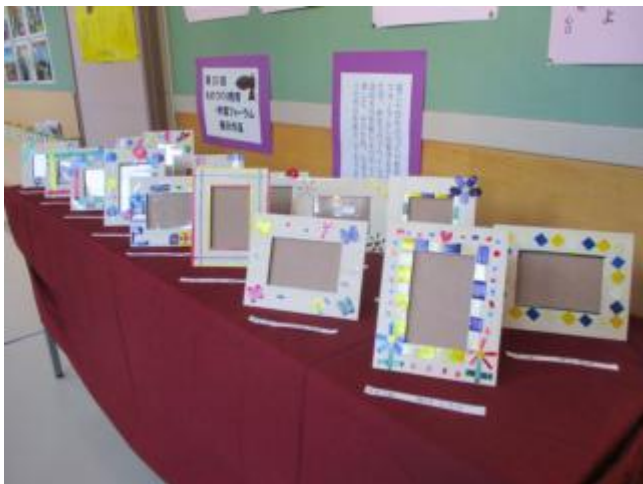
大森麦わら細工を用いた写真立て

先週、縮小開催となってしまいました「ものづくり教育・学習フォーラム」にて、展示予定であった4年生児童の作品「大森麦わら細工を用いた写真立て」は、教員室前の廊下に展示しました。1月24日（月曜）～26日（水曜）16時～18時「校内書き初め展」の保護者鑑賞等に合わせて、ぜひ、ご覧ください。