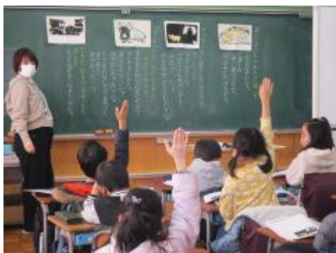
たくさん発表していました

「はるばる園の新しい友だち」。はるばる園に新しくやってきたかばさんのお話を通して、「みんなが笑顔になるために大切なことは何か？」みんなで話し合っていました。