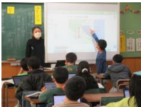
電子黒板を使って発表しました