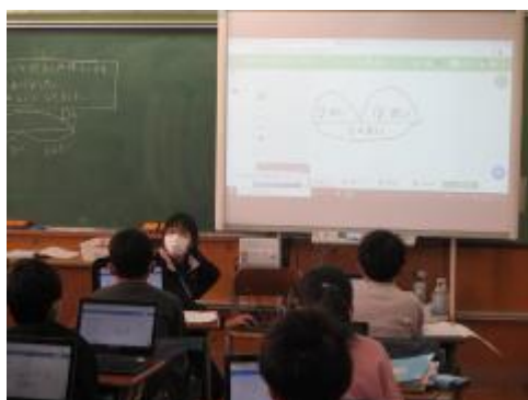
友達の表した図をみんなで確かめました