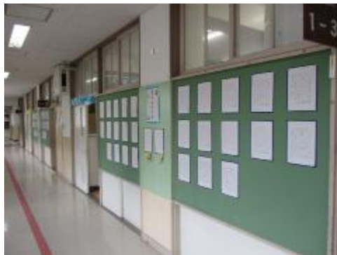
大田区書き初め展出品作品（教員室前廊下） 1年生