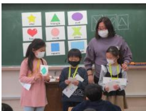
お手本を見せてくれました

今日は、色と形を英語で覚えて、「メモリーゲーム」をしました。前の人が出した色と形を覚えて、自分の色と形を付け加えていきます。覚えるのが難しく苦戦していましたが、みんな張り切って取り組んでいました。