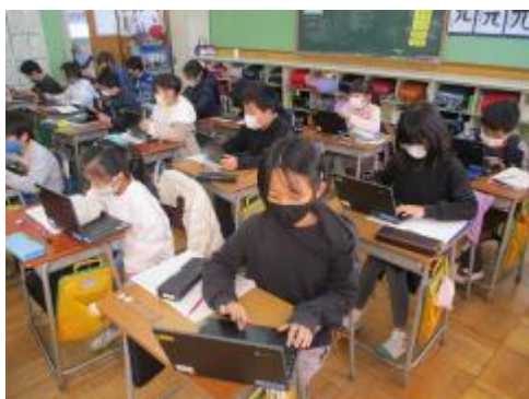
タブレットを上手に使っていました

わからない数を（四角）とし、図に表して考えてみました。タブレットを使い、上手に図に表していました。手書きでの入力ではなく、キーボード入力も上手に使って表せている人もいました。みんなタブレットを上手に使いこなしてびっくりしました。