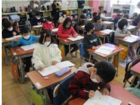
よく考えています