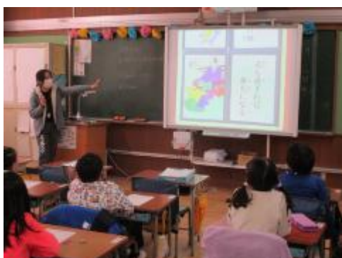
昔の字や言葉もありました

今日のおかしあそびは「いろはかるた」。いろはかるたの楽しみ方を知り、グループに分かれて実際にやってみました。とっても楽しそうに遊んでいます。