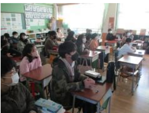
画面を見つめる6年生