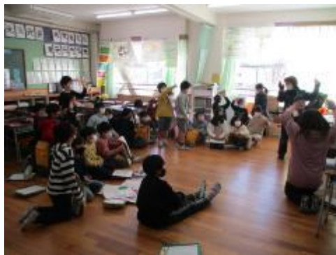
各教室から出し物を配信