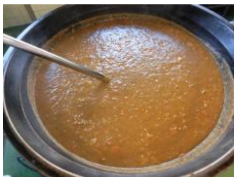
いつも愛情をこめて作っています！