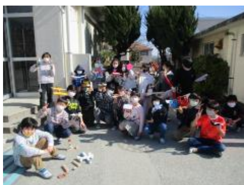
作品を持って記念写真