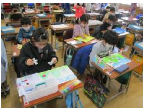
自分の世界に入り込んで

自分が乗ってみたいものを描いて切り取り、行ってみたいところも描き、そこに貼り付けました。うさぎ、象、ドラゴン、ライオン、ちょうちょなど、いろいろなものに乗って、思い思いの楽しい世界に行っていました。