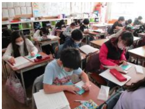
実際に打ってみました