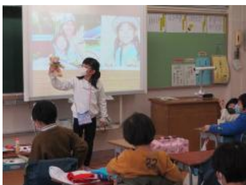
電子黒板も使って発表です

「これまでのわたし これからのわたし」という単元の学習に合わせ、「〇さいのころはこうだった」と写真や文章を使って、カードにまとめています。今日は「4さいから6さいのころ」の発表をしました。その頃の懐かしい物を持ってきてみんなに見せると「それ、知ってる！」など、見ているみんなも懐かしがって喜んでみていました。