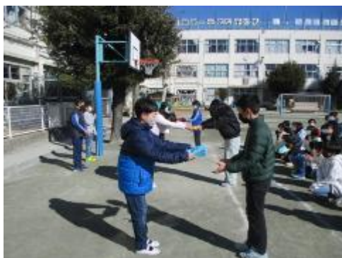
下級生からのプレゼント