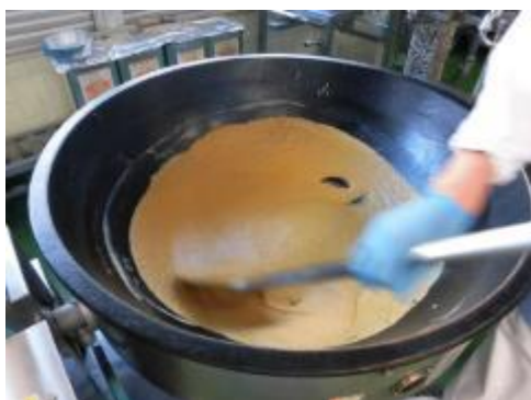
カレーのルウを作っています。

今日のいちごは、佐賀県の「いちごさん」という品種です。佐賀県・JA・いちごの生産者さんが7年もの時間をかけて、15000株の中から選び抜かれた自信作のいちごだそうです。華やかで優しい甘さが特徴です。