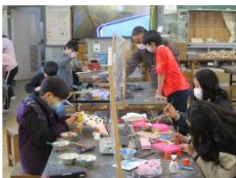
集中して取り組んでいました

角材や板を切って、釘を打ち込み組み合わせ、思い思いの「とびたいカタチ」を作りました。弓矢、こいのぼり、鳥、…様々な作品が出来上がりました。