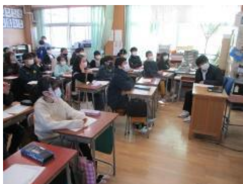
楽しそうに見ている6年生