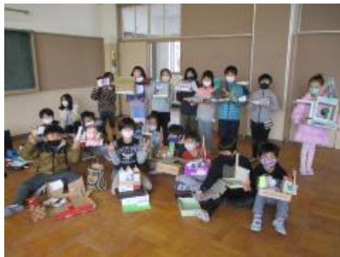
楽しいお家の完成です！