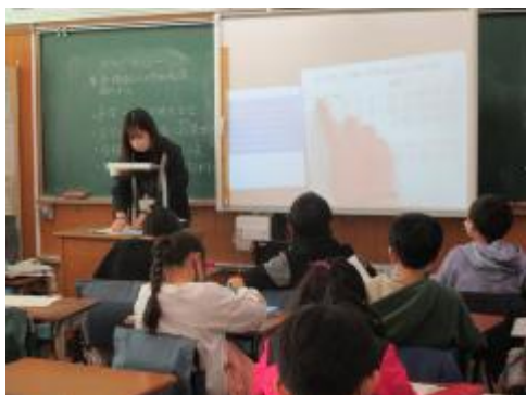
先生の説明を聞いて

4年生の総合的な学習の時間「心のバリアフリー」。今日は、点字キットを使い、実際に画用紙に穴を開け、点字を打ってみました。点字一覧表を見ながら、間違えないように、慎重に打っていました。実際に点字を打つことで、点字が少し身近に感じられたようでした。