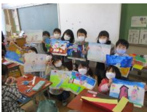
すてきな作品になりました