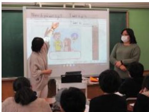
しっかり聞き取り

「Where do you want to go?」「I want to go to ○○.」「I want to ○○.」の構文を使った様々な文章を聞き取り、覚え、それを使った会話練習をしました。沖縄、兵庫、様々な場所を思い浮かべながら、英会話を楽しみました。