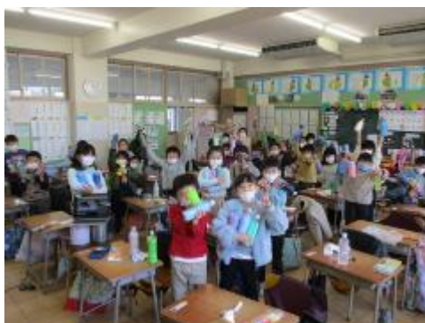
素敵ないろみずの完成です！