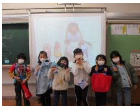
今日の発表メンバーです