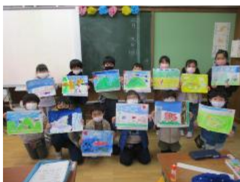
すてきな作品ができました