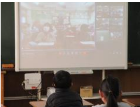
各教室でオンライン参加

コロナ禍のため、今年度の6年生を送る会は、第一部はたてわりのクラス毎に、6年生に向けてオンラインで出し物を配信し、第二部では6年生を校庭に集め、5年生代表児童による会を開きました。最後にサプライズとして、各教室と屋上から全校合唱による「にじ」をプレゼントしました。とても温かな会にすることができました。