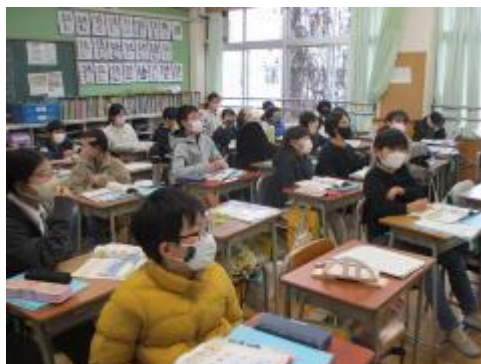
すらすら言えるように練習しました