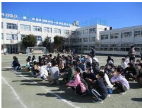
教室と屋上の歌声を聴く6年生