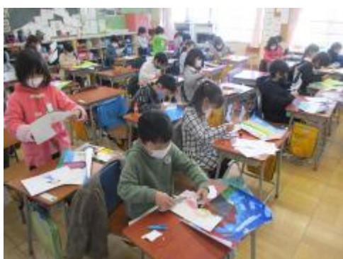
描いて、切って、貼って