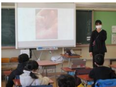
何の赤ちゃんだろう？

電子黒板に映し出されたどうぶつの赤ちゃんを見て、何の動物かを予想しました。わかった子が、答えのヒントを考えて発表したり、みんなとっても楽しそうに取り組んでいました。