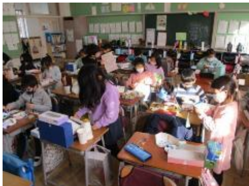
黙々と作っていました

「小さなともだちがよろこぶいえをつくろう。」をテーマに、お家から持ってきた空き箱などを組み合わせて、想像力を働かせて、机、いす、ベッドなど、様々なものをお家に入れて、楽しいお家を作りました。