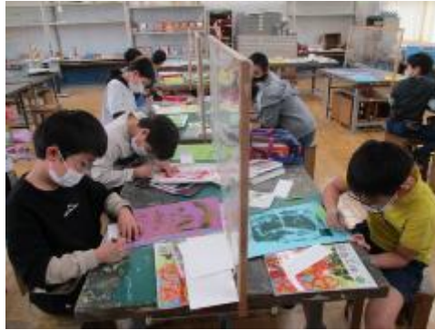
集中して取り組んでいます