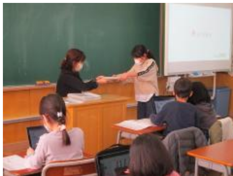
修了証授与の様子 2年生