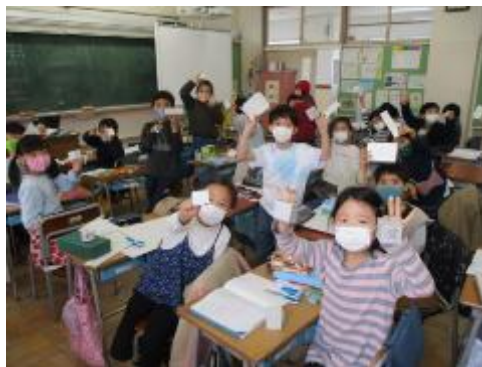
はこができました！