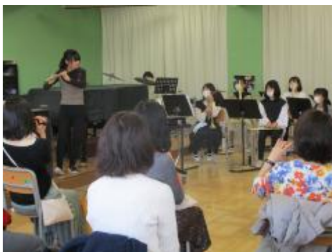
先生からフルート演奏のプレゼント