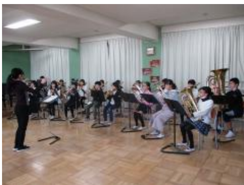
「ポリウオリドゥウル」

懸命練習し、「ポリウオリドゥウル」「明日があるさ」の2曲を仕上げました。短い練習期間にもかかわらず、素晴らしい演奏で、聴きにきていただいた保護者の方々からも大きな拍手をいただきました。卒業に向けて、また一つ大切な思い出を作ることができました。