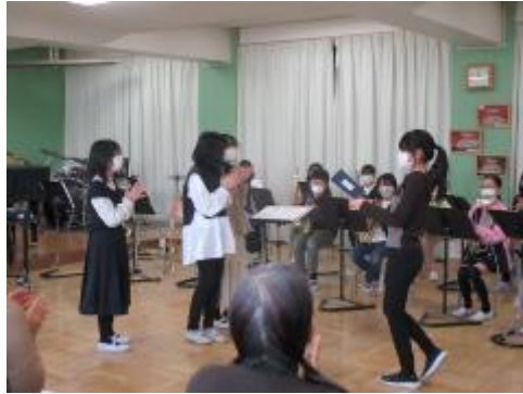
子供たちからの感謝の手紙