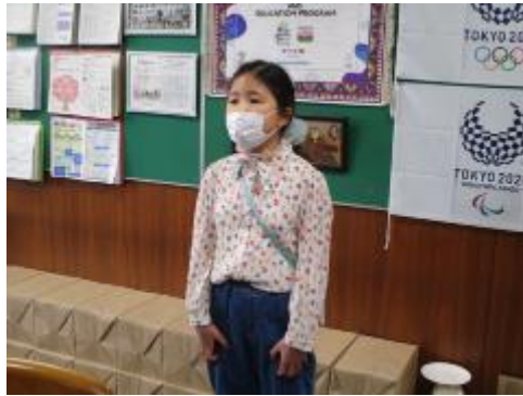
2年生による児童代表の言葉