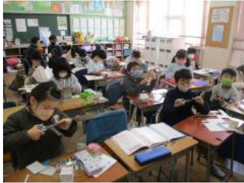
上手に切り取って、貼り付けて