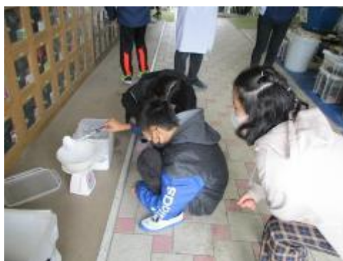
海水も作っています