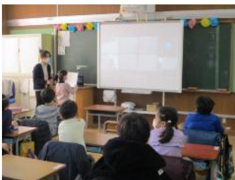
1年生の絵を発表です