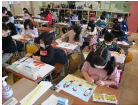
1年生 図工「1年生の思い出」