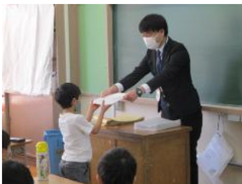
修了証授与の様子 2年生