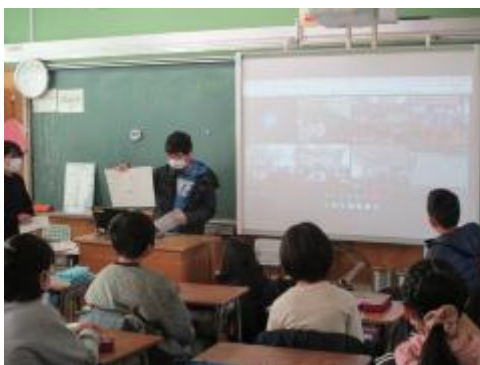
見本を見せています