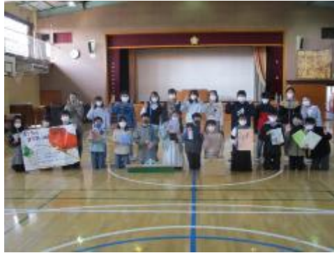
委員長、副委員長さんで集合写真