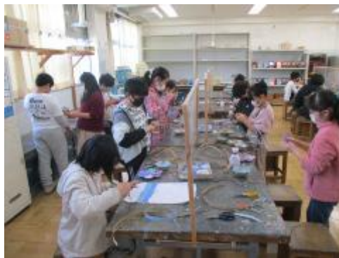
4年生 図工「身につけるカタチ」