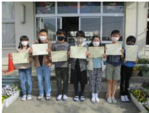
小学生科学展、俳句大会受賞者