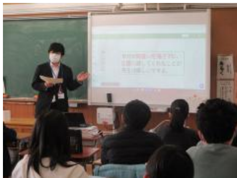
6年生 国語「今、私は、ぼくは」