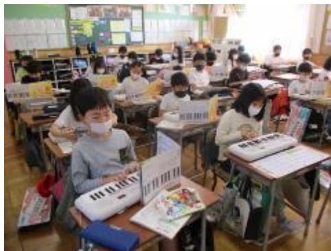
2年生 音楽 ミニキーボード演奏