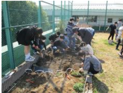
5年生 総合 バケツ稲の後片付け