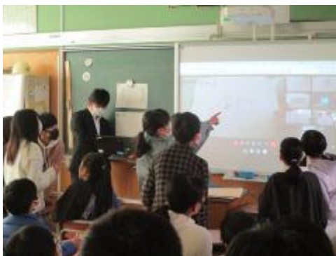
6年生が当てています