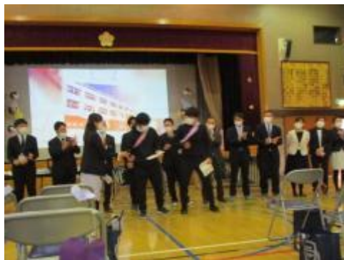
先生たちの出し物