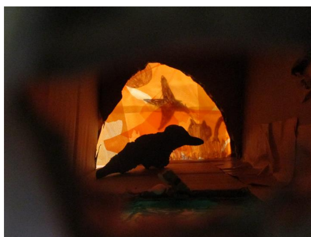
5年生「のぞいてみると」をのぞいてみた様子