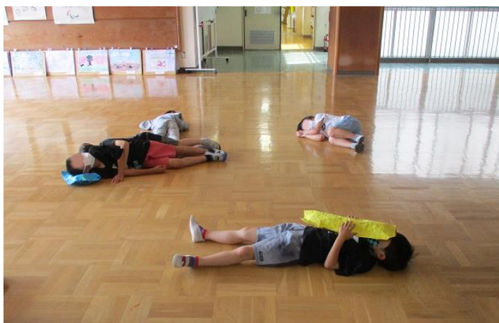
2年生 「ゆめまくら・ゆめえ」に取り組んでいる様子