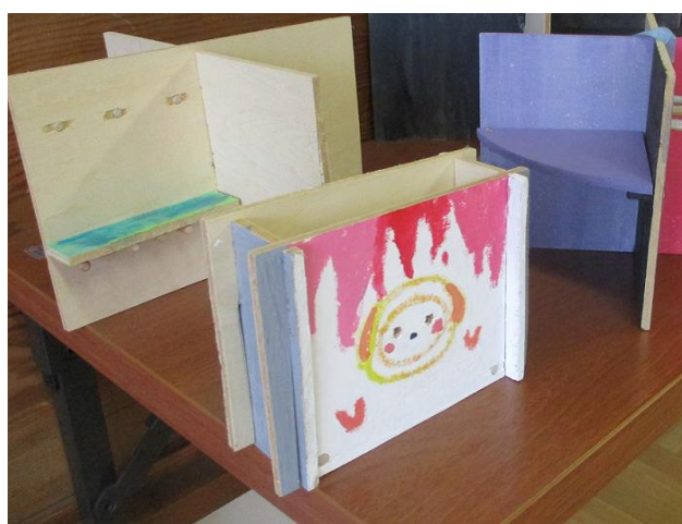
6年生「やさしい組み木」※釘やボンドを使わずに木を組み立てて、生活の役に立つ物をつくっている。