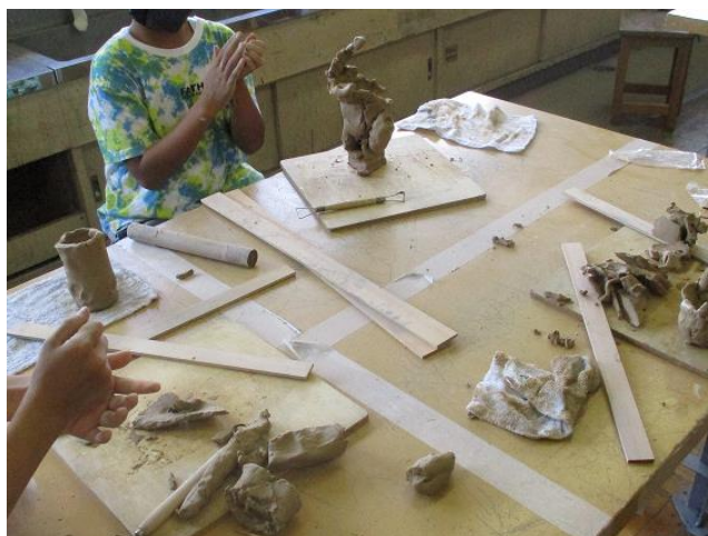
4年生「炎のテラコッタワー」たたらづくりの学習