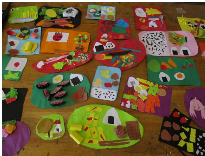
3年生「ぺたんこランチ」