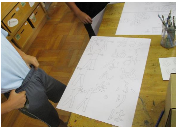
4年生「人権ポスター」に挑戦