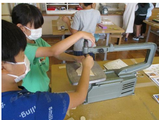
5年生「糸のこスイスイ」電動糸のこぎりを使った学習