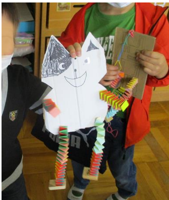
2年生 「ばねばねフレンド」