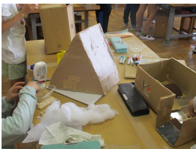
5年生「のぞいてみると」の学習