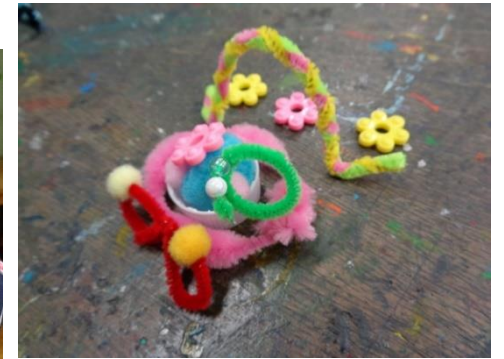
↑2年「はさんでならべて」