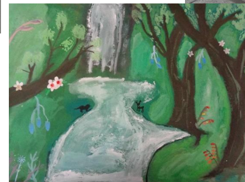
6年「ジャングルの生命」→