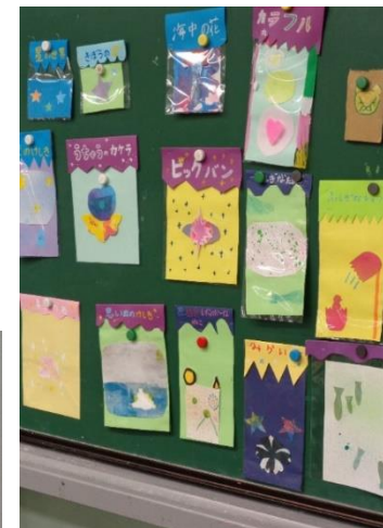
↑4年「おみやげアート」