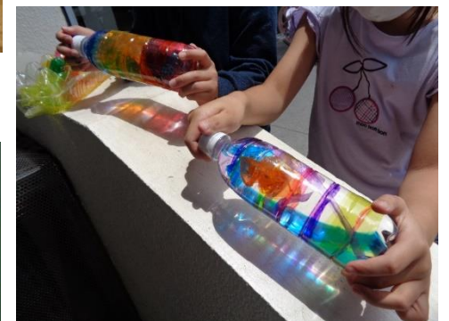
↑2年「ひかりのプレゼント」