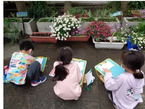
↑2年「おはなみスケッチ」