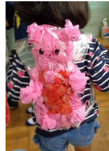
↑3年「カラフルフレンド」