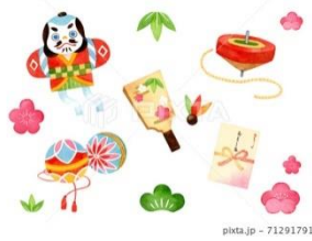
picta.jp - 71291791