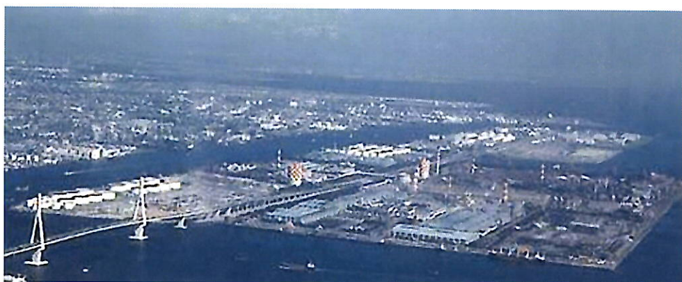
JFEスチール東日本製鉄所

それぞれの家庭では、もらったお土産と共に、子どもたちは学んだ知識を得意げに話してくれたことでしょう。