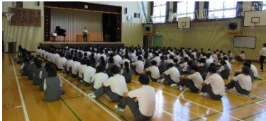
【始業式の整列の様子】

始業式では、「自分の力を信じて、色々なことに挑戦していこう!」と話しました。今学期も、生徒たちの成長を支え、学力向上や自己肯定感を育むことに、全教職員一同、力を尽くしてまいりますので、どうぞよろしくお願いいたします。