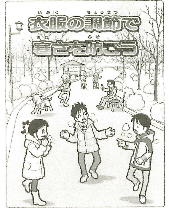
左...手前左の女子の髪形、手前中央の男子のスカート、手前右の男子のジャケットのボタン、右奥の犬の散歩をしている男性の帽子、奥の後ろ姿の女性のホーア、ハズチに座っている男性のホーア、右奥の読み