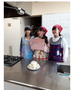
クッキングバトル