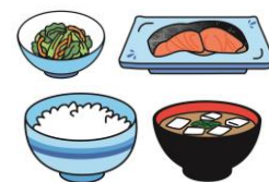
ごはん・焼き魚 野菜の和え物・みそ汁