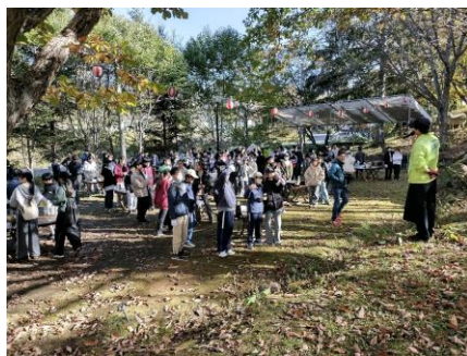
8 : 30 飯盒炊飯開始