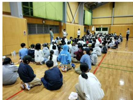
レクリエーション(開会式)