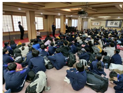
12 : 00 閉校式