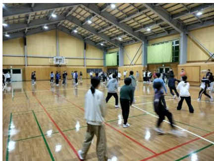
レクリエーション (ドッチボール)