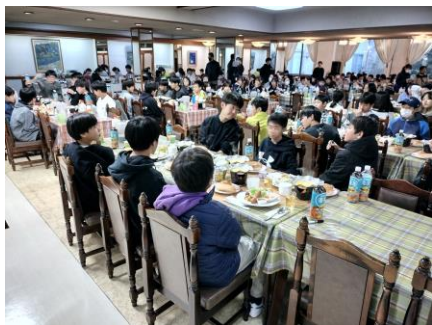
7 : 30 朝食