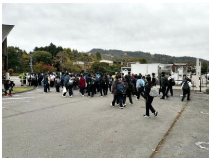
15:25 クイズウォーキング終了