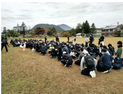
軽井沢クイズウォーキング開始