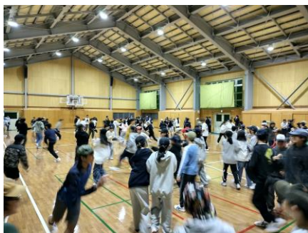
レクリエーション(増え鬼)