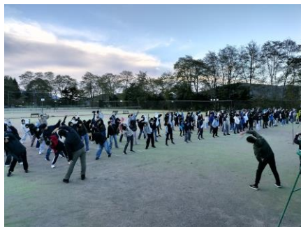
7:00 テニスコートでラジオ体操