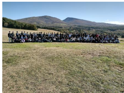
根子岳と四阿山を背景に集合写真