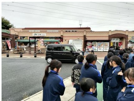
10:43 三芳サービスエリア到着