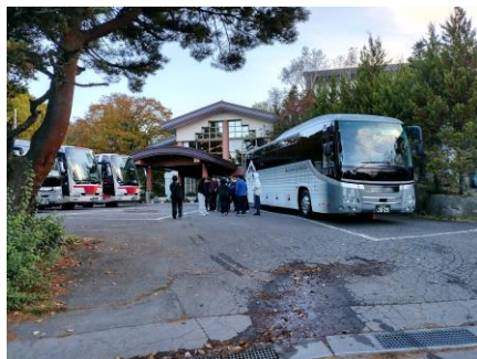
6:30 起床・テニスコートへ