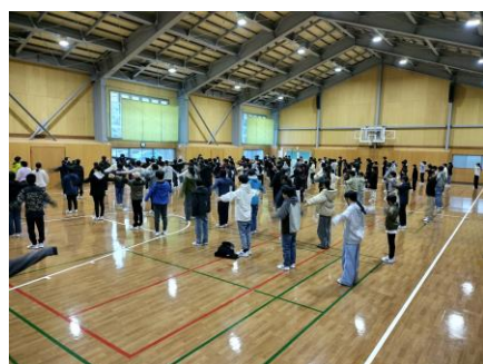
3日目6:45 体育館でラジオ体操