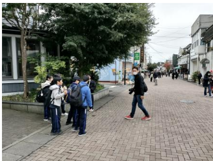
軽井沢観光会館前