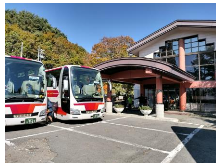
12 : 27 学校へ向けて出発