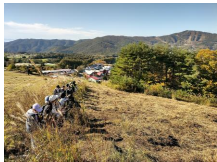
ダボスの丘に向かう