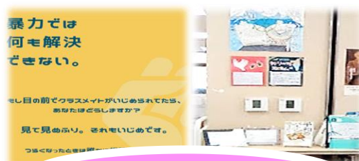
シビック・アクション