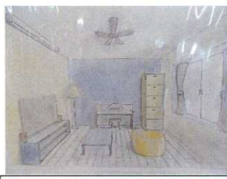
2年 夢のマイルーム