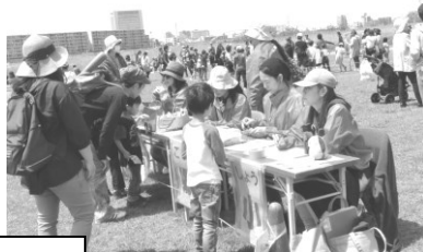
ガーデンパーティにて