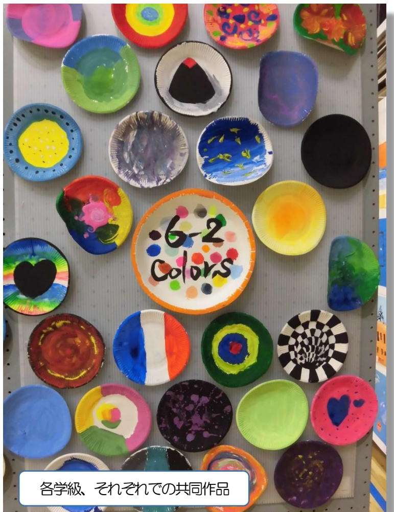
各学級、それぞれの共同作品