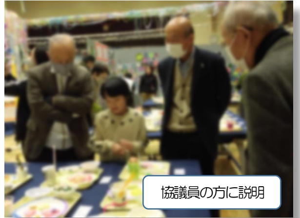
協議員の方に説明