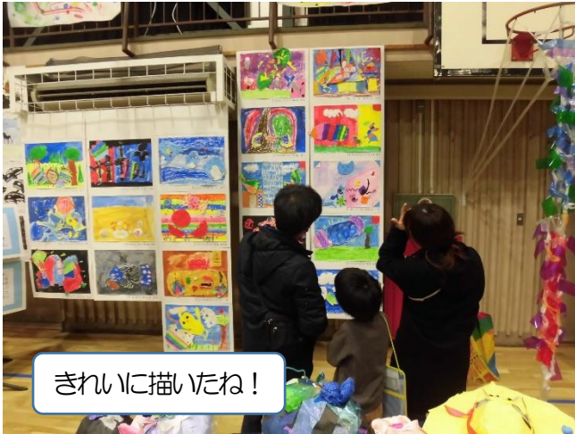
きれいに描いたね!