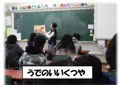
うでのいいくつや