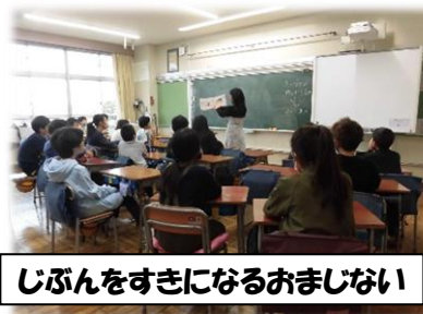
じぶんをすきになるおまじない