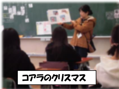
コアラのクリスマス