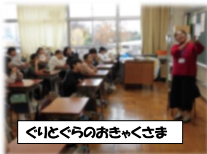
ぐりとぐらのおきゃくさま