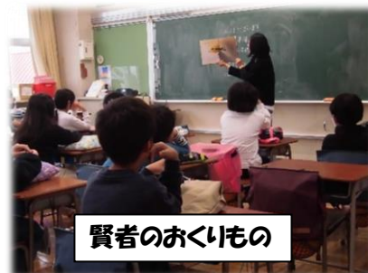
賢者のおくいもの

この日は4・5・6年生の各学級への読み聞かせでした。各ボランティアさんの選書は、高学年の子供たちに合った絵本でした。