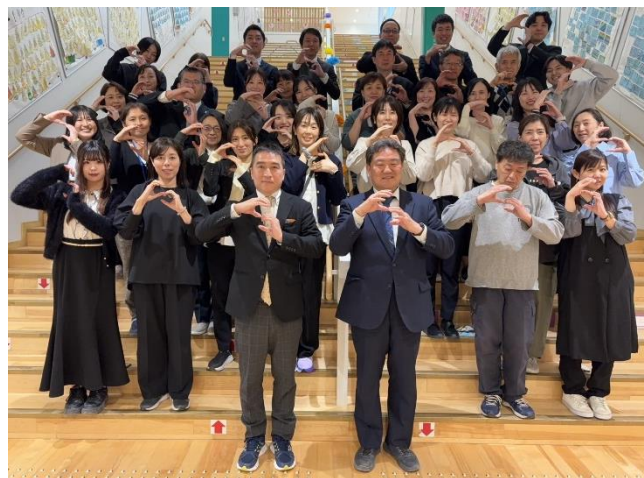
S himoda 志茂田の「S」 S parkplug 火付け役・原動力の「S」 S ustainability 持続可能性の「S」

このホームページを通して、在校生、卒業生、保護者、地域の皆様、そして、これまで志茂田小学校に関わられた全ての皆様の想いがつながることを願っています。