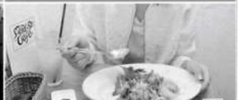
4 いつものお店!なう(^^) /