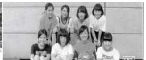
2 バスケ楽しかった(^^) /