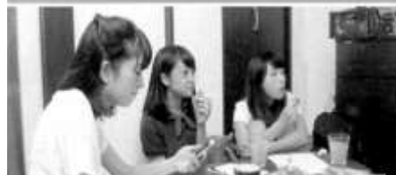
3 ミナの家で勉強中ww